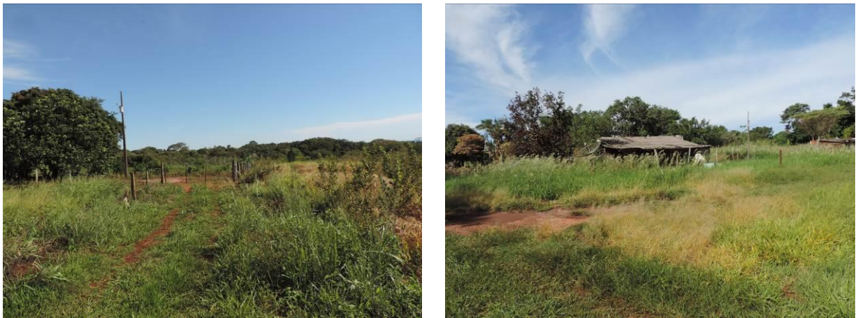
Figura 11: Área prevista para implantação da EEEB 05 Projetada, Antônio João, MS.

A EEEB 005 Projetada, elevatória com função de recalque do esgoto bruto para a EET Antônio João, será implantada no final da Rua Presidente Tancredo Neves, coordenadas geográficas UTM (21 K) 608.181 E / 7.545.079 S (Figura 11).