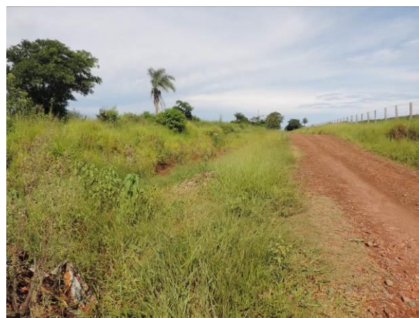
Figura 7: Área prevista para implantação da EEEB 002 Projetada, Antônio João, MS.