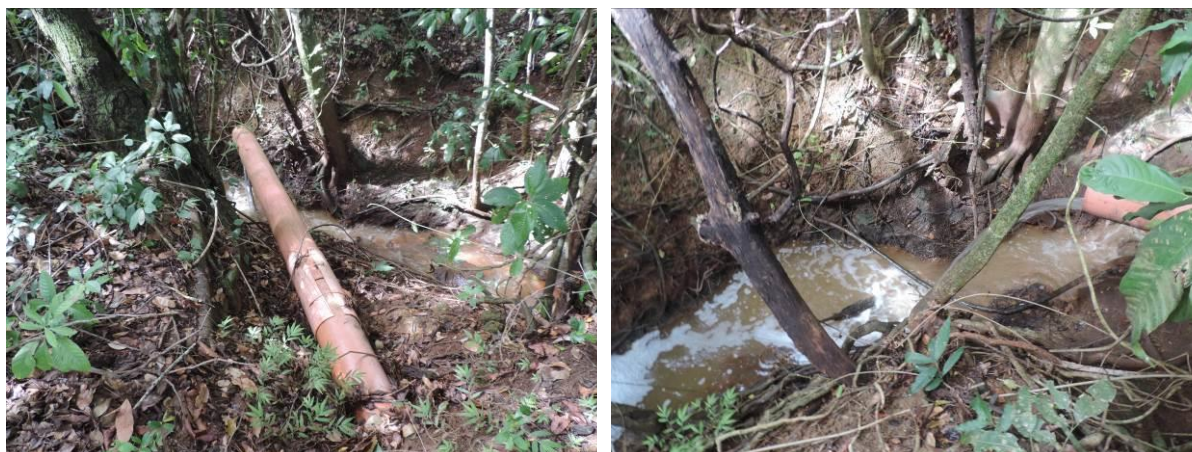
Figura 5: Local de lançamento do emissário da ETE Antônio João no Córrego Cachoeira do Bugre, Antônio João, MS.

Não foram identificados passivos ambientais decorrentes de vazamento, erosão e acondicionamento de resíduos sólidos na área da ETE Antônio João. Entretanto o lançamento do efluente não é subfluvial (Figura 5).