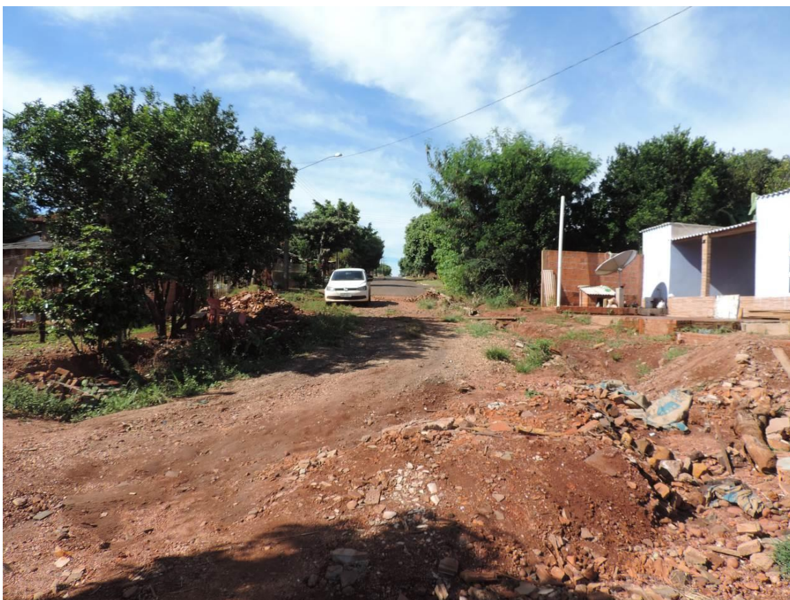
Figura 10: Processos erosivos presentes na área prevista para implantação da EEEB 004 Projetada, Antônio João, MS.

Foram identificados processos erosivos na rua de acesso à área prevista para a implantação da EEEB 004 Projetada (Figura 10).