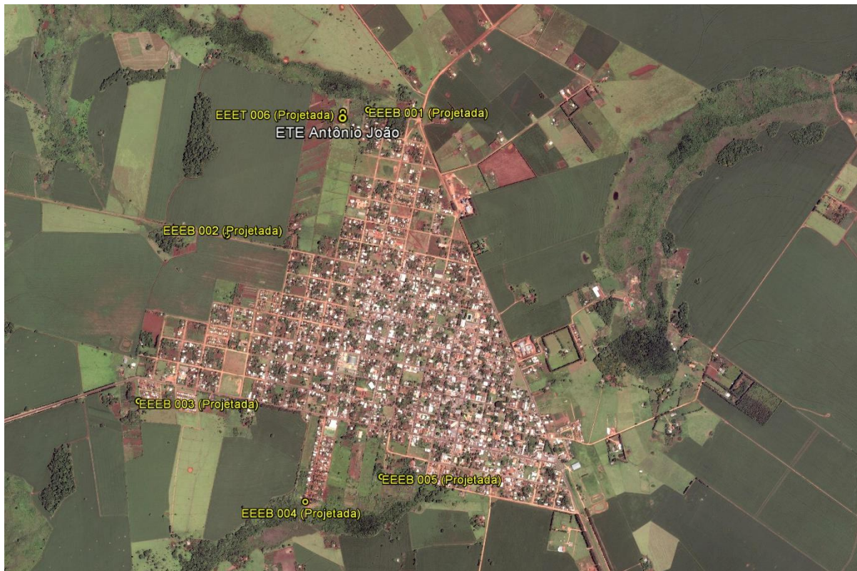
Figura 1: Localização das Unidades Operacionais existentes e projetadas na cidade de Antônio João, MS.

A cidade de Antônio João possui uma Estação de Tratamento de Esgotos (ETE) em operação. Possui, ainda, áreas selecionadas para a implantação de cinco Estações Elevatórias de Esgoto Bruto (EEEB) e uma Estação Elevatória de Esgoto Tratado (EEET) projetadas (Figura 2).