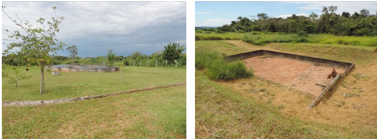
Figura 2: Vista geral da ETE Antônio João, Antônio João, MS.

Atualmente encontra-se totalmente cercada com cercas rurais de arame liso e alambrado. A ETE contém poucas árvores esparsas em seu interior, mas não apresenta cortina arbórea (Figuras 2 e 3).