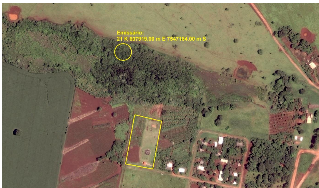
Figura 3: Vista aérea da ETE Antônio João e entorno, Antônio João, MS.

A ETE Antônio João, de acordo com o Sistema Interativo de Suporte ao Licenciamento Ambiental (SISLA) de MS, não se sobrepõe a nenhuma Unidade de Conservação, Terras Indígenas, Áreas de Perambulação, Quilombolas e Assentamentos Rurais (Figura 4).