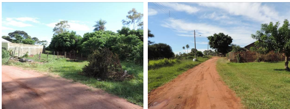
Figura 8: Área prevista para implantação da EEEB 003 Projetada, Antônio João, MS.

A EEEB 003 Projetada, elevatória com função de recalque do esgoto bruto para a ETE Antônio João, será implantada na Rua A02, coordenadas geográficas UTM (21 K) 606.899 E / 7.545.486 S (Figura 8).