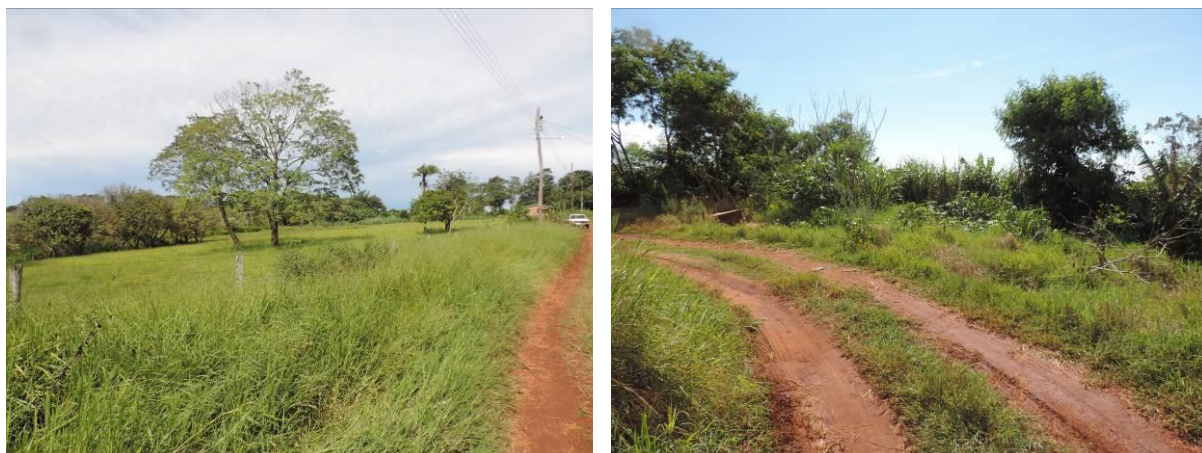
Figura 6: Área prevista para implantação da EEEB 001 Projetada, Antônio João, MS.

A EEEB 001 Projetada, elevatória com função de recalque do esgoto bruto para a ETE Antônio João, será implantada na esquina da Rua Antonio João com a Rua Ramão Afonso, coordenadas geográficas UTM (21 K) 608.124 E / 7.547.010 S (Figura 6).