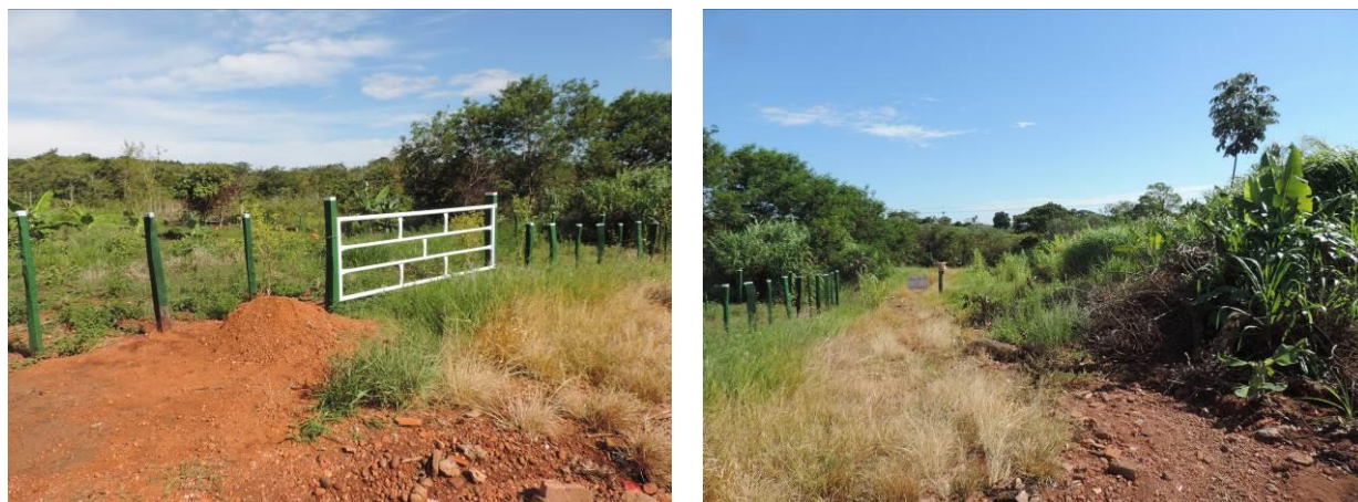
Figura 9: Área prevista para implantação da EEEB 004 Projetada, Antônio João, MS.

A EEEB 004 Projetada, elevatória com função de recalque do esgoto bruto para a ETE Antônio João, será implantada no final da Rua Fernando Saldanha, na saída norte da cidade, coordenadas geográficas UTM (21 K) 607.777 E / 7.544.950 S (Figura 9).