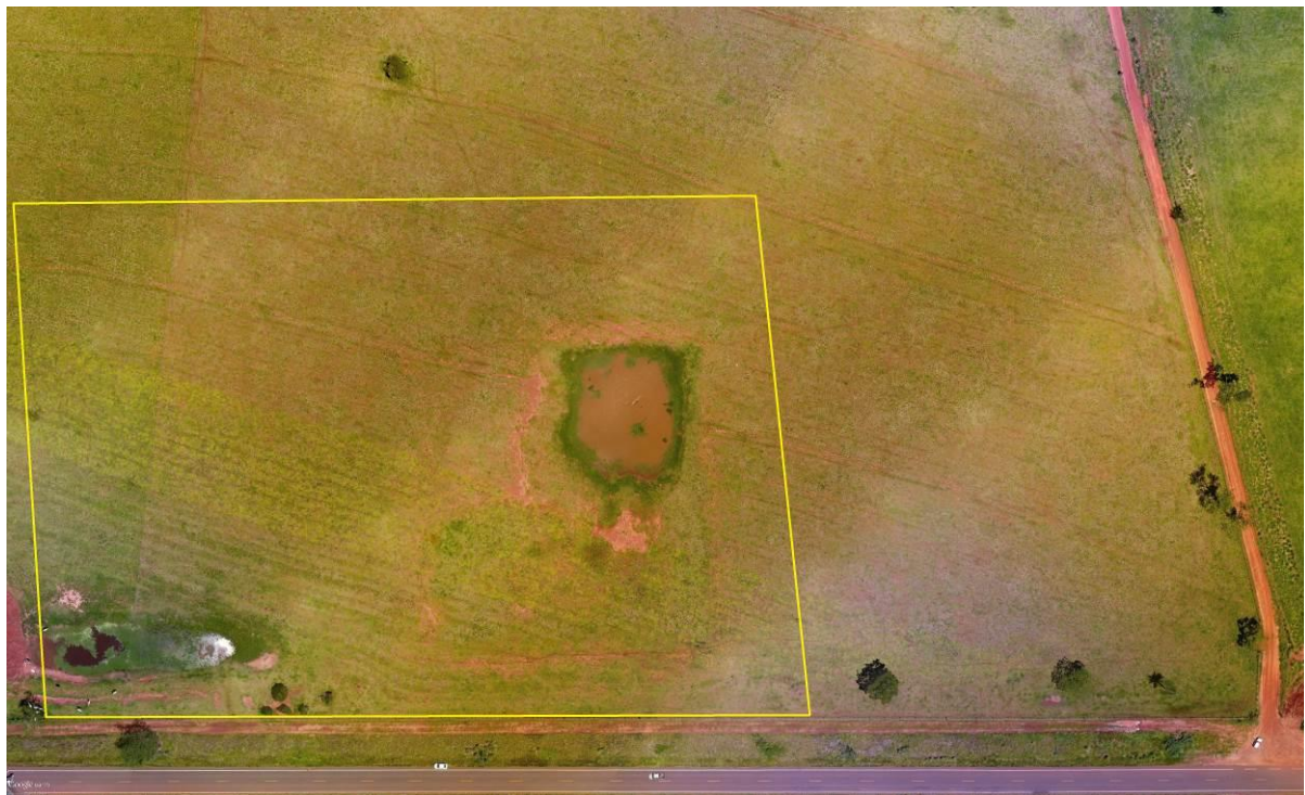
Figura 2: Vista aérea da ETE Anaurilândia Projetada, Anaurilândia, MS.

A ETE Anaurilândia Projetada será implantada na zona rural de Anaurilândia, na rodovia MS 395, coordenadas geográficas UTM (22K) 327.296 E / 7.547.723 S, distante 1.750 m do corpo receptor. A área é recoberta por gramíneas de pastagem e poucas árvores nativas esparsas (Figuras 2 e 3).