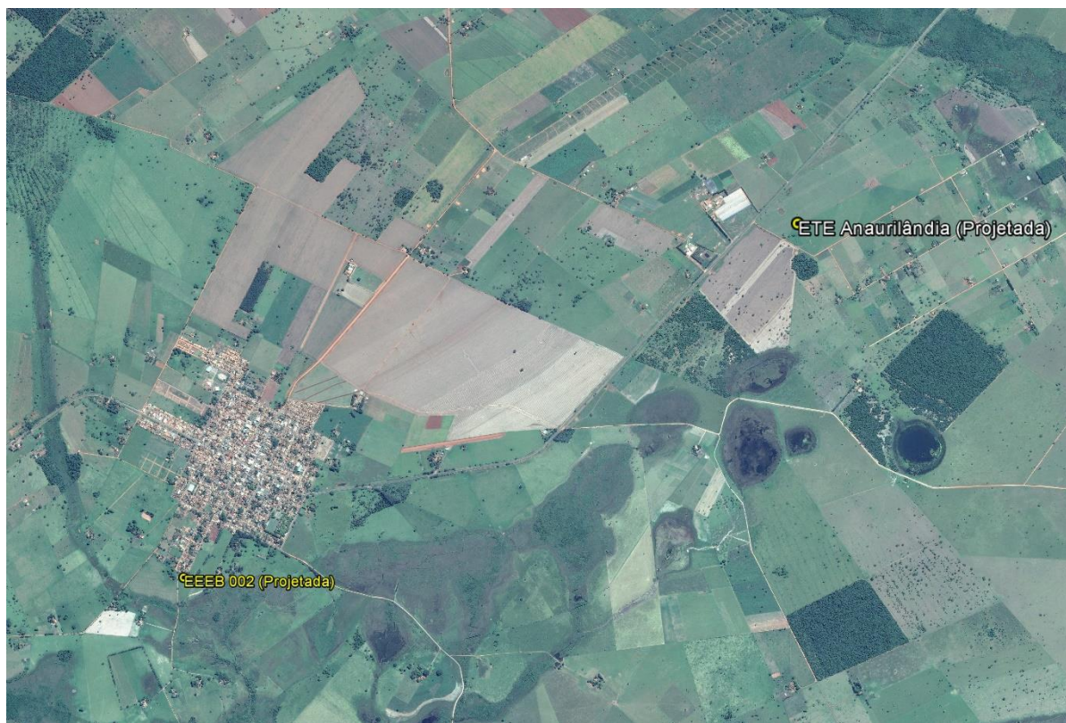
Figura 1: Localização das Unidades Operacionais existentes e projetadas na cidade de Anaurilândia, MS.

A cidade de Anaurilândia não possui Sistema de Esgotamento Sanitário (SES), porém possui locais selecionados para a implantação de uma Estação de Tratamento de Esgotos (ETE) e uma Estação Elevatória de Esgoto Bruto (EEEB) projetadas (Figura 1).