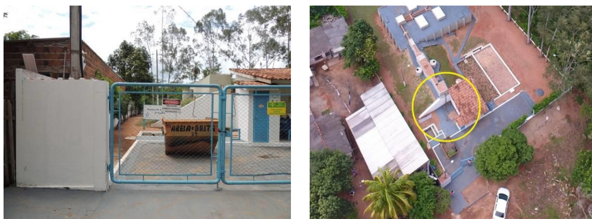
Figura 5: Vista geral da EEEB ETE 001, Anastácio, MS.

A EEEB ETE 001 localiza-se na Rua 8 de Maio 4, coordenadas geográficas UTM (21 K) 625.301 E / 7.734.621 S, totalmente cercada por muros e alambrado, com portão de grade e tranca para veículos e pedestres, tendo como função recalcar o esgoto afluyente para a ETE Anastácio (Figura 7). Não possui informação sobre extravasor.