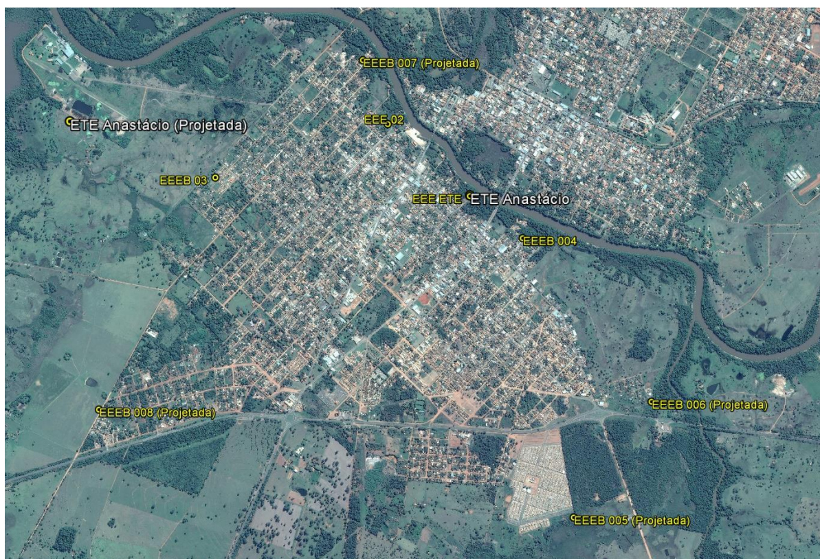
Figura 1: Localização das Unidades Operacionais existentes e projetadas na cidade de Anastácio, MS.

A cidade de Anastácio possui uma Estação de Tratamento de Esgotos (ETE) e quatro Estações Elevatórias de Esgoto Bruto (EEEB), todas em operação. Possui, ainda, áreas selecionadas para a implantação de uma Estação de Tratamento de Esgotos (ETE) e de quatro Estações Elevatórias de Esgoto Bruto (EEEB) projetadas (Figura 1).