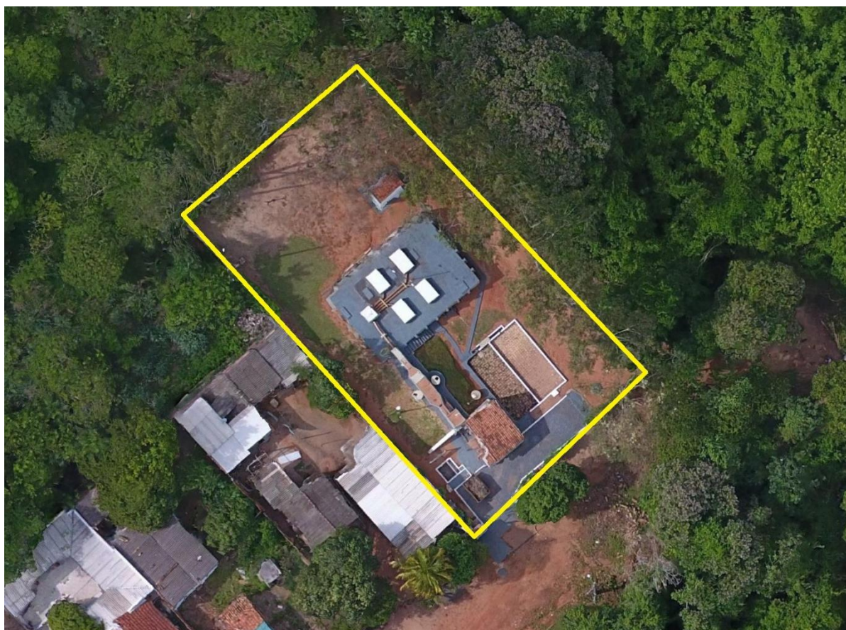
Figura 2: Vista aérea da ETE Anastácio, Anastácio, MS.

A ETE Anastácio está localizada na zona urbana de Anastácio, na Rua 8 de Março, nº 4, coordenadas geográficas UTM (21 K) 625.299 E; 7.734.627 S, distante 70 m do corpo receptor. Encontra-se totalmente cercada por muros e alambrado, com portão de grade e tranca para veículos e pedestres. Apresenta cerca viva na fachada e mata nativa ao redor (Figuras 2 e 3).