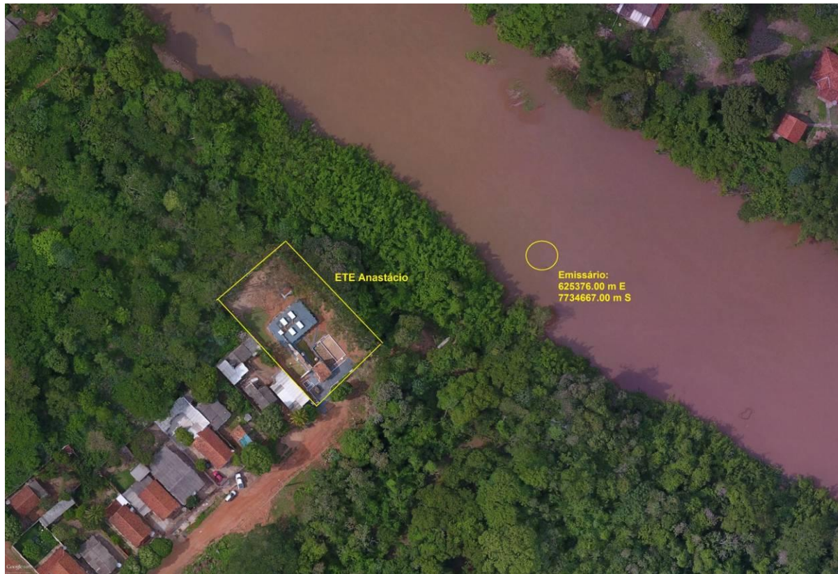
Figura 3: Vista aérea da ETE Anastácio e entorno, Anastácio, MS.

A ETE Anastácio, de acordo com o Sistema Interativo de Suporte ao Licenciamento Ambiental (SISLA) de MS, se sobrepõe à Zona de Amortecimento (ZA) (0 a 3 km; Resoluções CONAMA nº 428/2010 e nº 473/2015) do Parque Natural Municipal da Lagoa Comprida (PNMLC) localizada no município de Aquidauana, Unidade de Conservação de Proteção Integral e sem Plano de Manejo estabelecido (Figura 4).