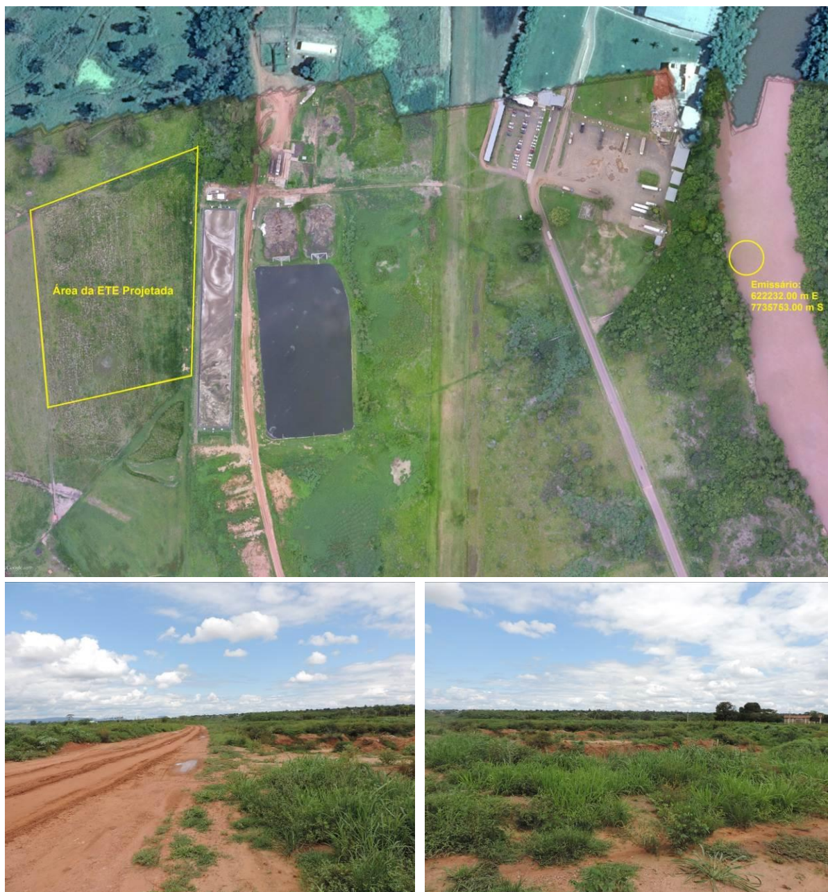
Figura 9: Vista da área pretendida da ETE Anastácio Projetada, Anastácio, MS.

A ETE Anastácio Projetada, de acordo com o Sistema Interativo de Suporte ao Licenciamento Ambiental (SISLA) de MS, não se sobrepõe a nenhuma Unidade de Conservação ou Zonas de Amortecimento, nem a Terras Indígenas, Áreas de Perambulação, Quilombolas e Assentamentos Rurais (Figura 6).