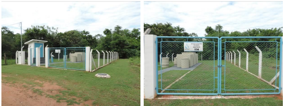
Figura 8: Vista geral da EEEB 004, Anastácio, MS.

A EEEB 004 localiza-se na Rua Bomfim esquina com a Rua Ademar dos Santos, coordenadas geográficas UTM (21 K) 625.738 E / 7.734.281 S, completamente cercada por cerca com alambrado e portão com trancas para veículos e pedestres. Não possui cortina arbórea e tem como função recalcar o esgoto afluyente até o coletor existente na Av. Manoel Murinho (Figura 10). Não possui informação sobre extravasor.