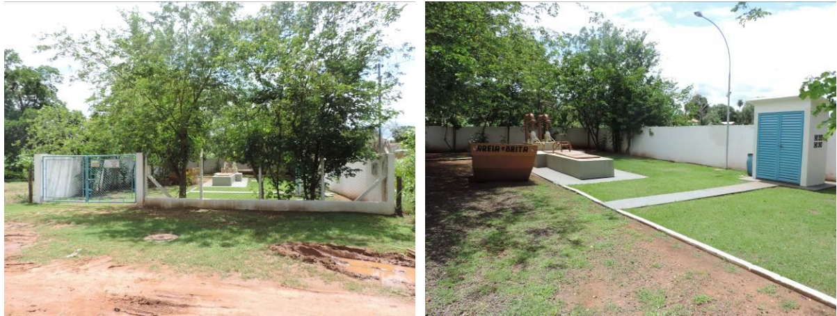
Figura 6: Vista geral da EEBB 002, Anastácio, MS.

A EEBB 002, de acordo com o Sistema Interativo de Suporte ao Licenciamento Ambiental (SISLA) de MS, se sobrepõe à Zona de Amortecimento (0 a 3 km; Resoluções CONAMA nº 428/2010 e nº 473/2015) do Parque Natural Municipal da Lagoa Comprida localizada no município de Aquidauana, Unidade de Conservação de Proteção Integral e sem Plano de Manejo estabelecido.