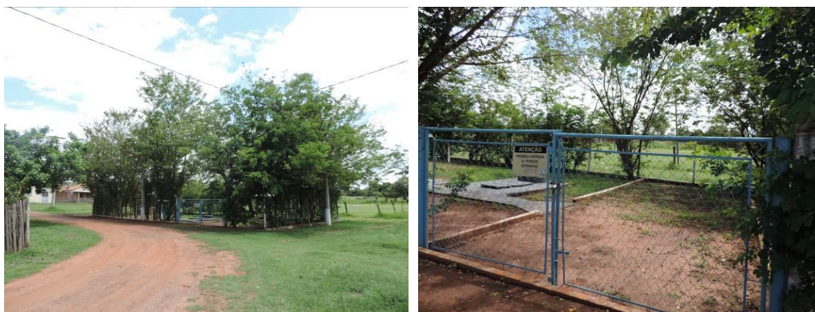
Figura 7: Vista geral da EEEB 003, Anastácio, MS.

A EEEB 003 localiza-se na Rua 18 de Março, coordenadas geográficas UTM (21 K) 623.199 E / 7.734.795 S, completamente cercada por cerca com alambrado e portão com trancas para veículos. Possui cortina arbórea e tem como função recalcar o esgoto afluyente para a EEEB 002 (Figura 9). Não possui informação sobre extravasor.