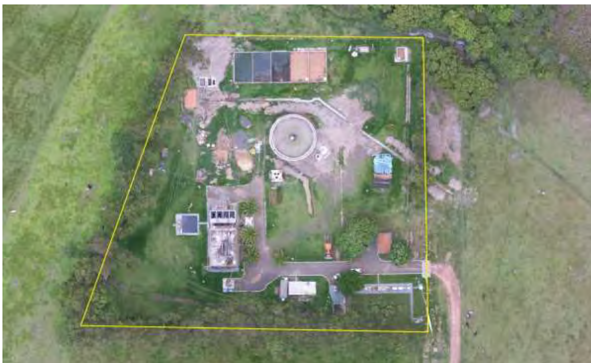
Figura 2: Vista aérea da ETE Aparecida do Taboado, Aparecida do Taboado, MS.