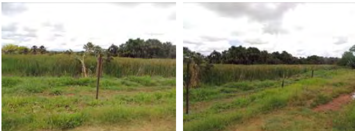
Figura 7: Área prevista para implantação da EEEB 002 Projetada, Aparecida do Taboado, MS.

A EEEB 002 Projetada será implantada na zona urbana de Aparecida do Taboado, na Avenida João Pedro Pedrossian, coordenadas geográficas UTM (22 K) 490.400 E / 7.778.164 S (Figura 8).