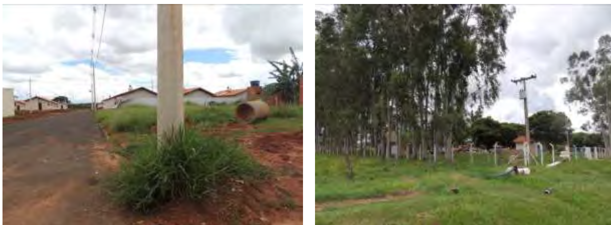
Figura 8: Área prevista para implantação da EEEB 003 Projetada, Aparecida do Taboado, MS.

A EEEB 003 Projetada será implantada na zona urbana de Aparecida do Taboado, na Rua Coxim com a Rua Amauri Ramos Firquim, coordenadas geográficas UTM (22 K) 488.188 E / 7.777.497 S (Figura 9).