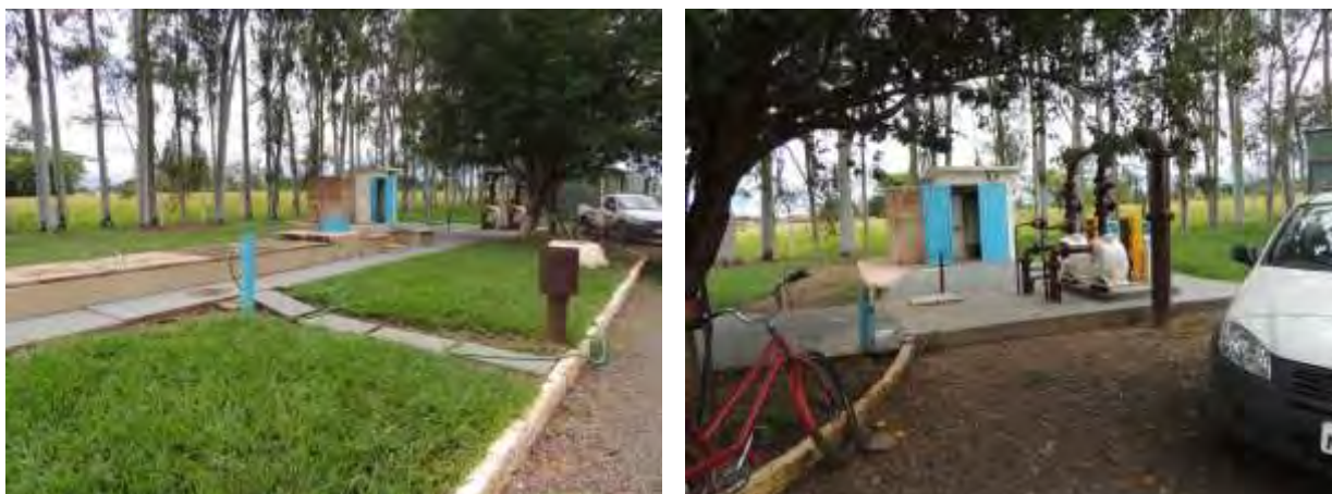
Figura 5: Vista geral da EEEB 007, Aparecida do Taboado, MS.

A EEEB 007, com função de recalque final para alimentação da ETE, localiza-se na zona urbana de Aparecida do Taboado, na Avenida João Pedro Pedrossian com Rua Sete de Setembro, dentro da área da ETE Aparecida do Taboado, coordenadas geográficas UTM (22 K) 490.600 E / 7.779.190 S. Encontra-se totalmente cercada com telas e portão com trancas para pedestres, com vegetação esparsa em seu interior e com cortina arbórea em parte do entorno (Figura 6).