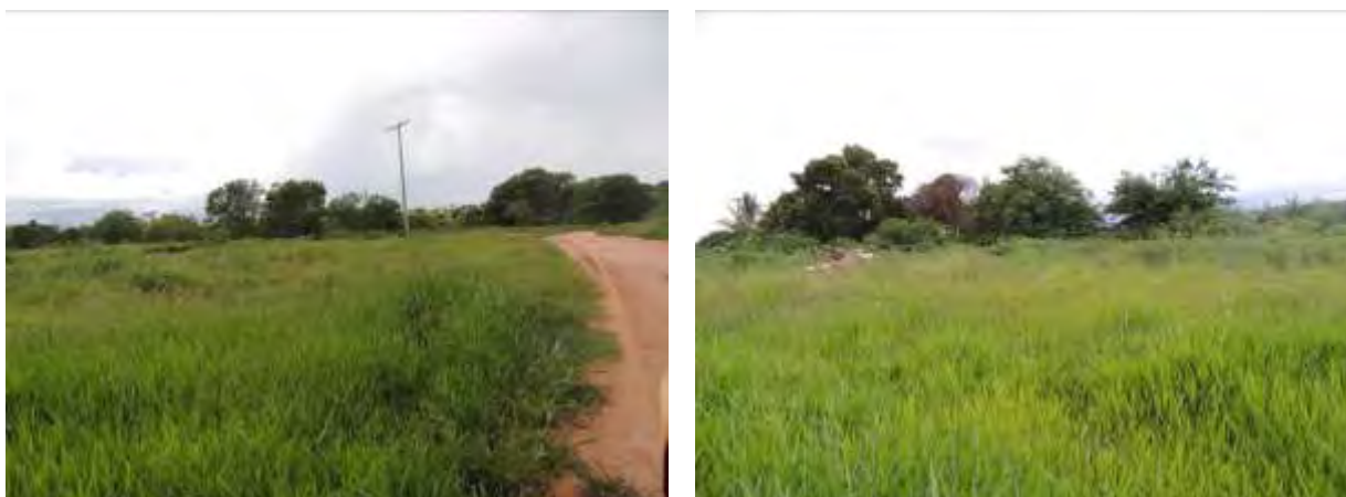
Figura 9: Área prevista para implantação da EEEB 004 Projetada, Aparecida do Taboado, MS.

A EEEB 004 Projetada, de acordo com o Sistema Interativo de Suporte ao Licenciamento Ambiental (SISLA) de MS, não se sobrepõe a nenhuma Unidade de Conservação ou Zonas de Amortecimento, nem a Terras Indígenas, Áreas de Perambulação, Quilombolas e Assentamentos Rurais.