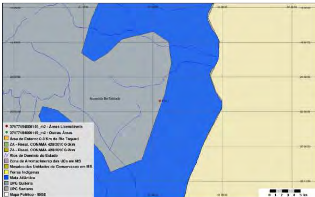
Figura 4: SISLA da ETE Aparecida do Taboado (IMASUL, 2016)

A área não é objeto de processos minerários.