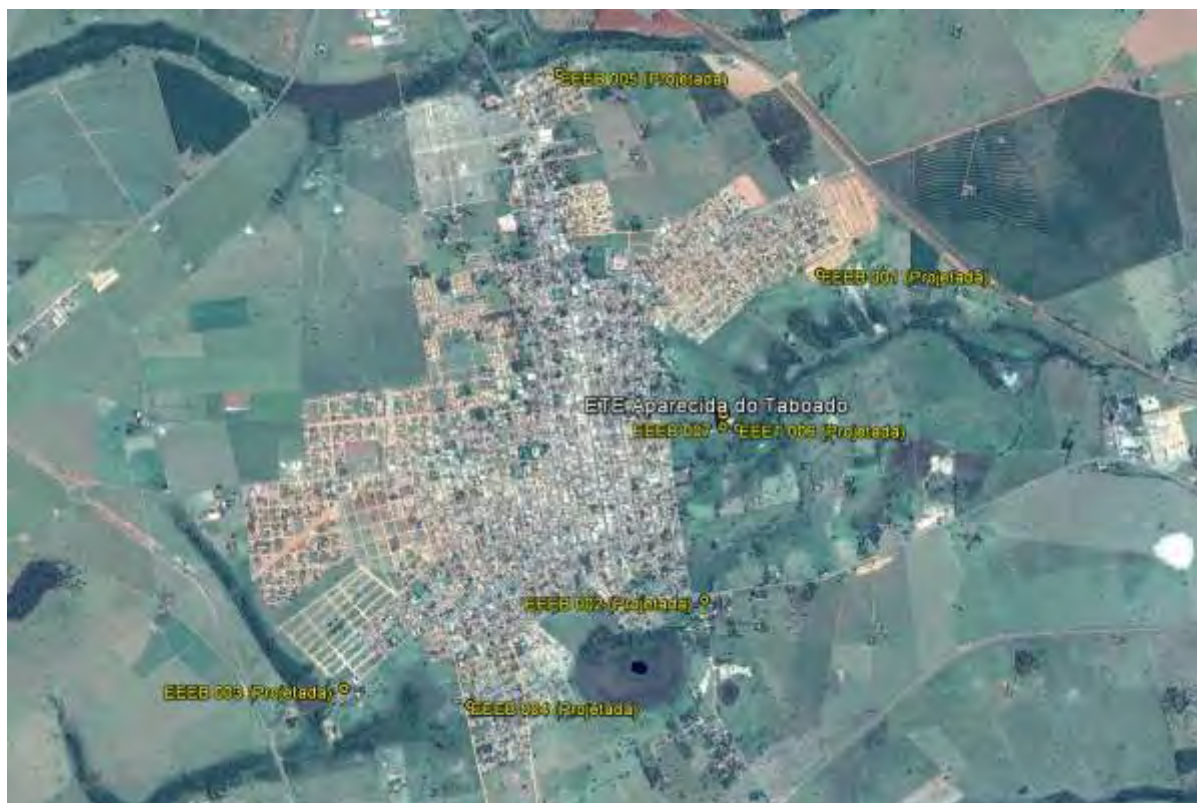
Figura 1: Localização das Unidades Operacionais existentes e projetadas na cidade de Aparecida do Taboado, MS.

A cidade de Aparecida do Taboado possui uma Estação de Tratamento de Esgotos (ETE) e uma Estação Elevatória de Esgoto Bruto (EEEB), ambas em operação. Possui, ainda, áreas selecionadas para a implantação de cinco Estações Elevatórias de Esgoto Bruto (EEEB) projetadas (Figura 1).