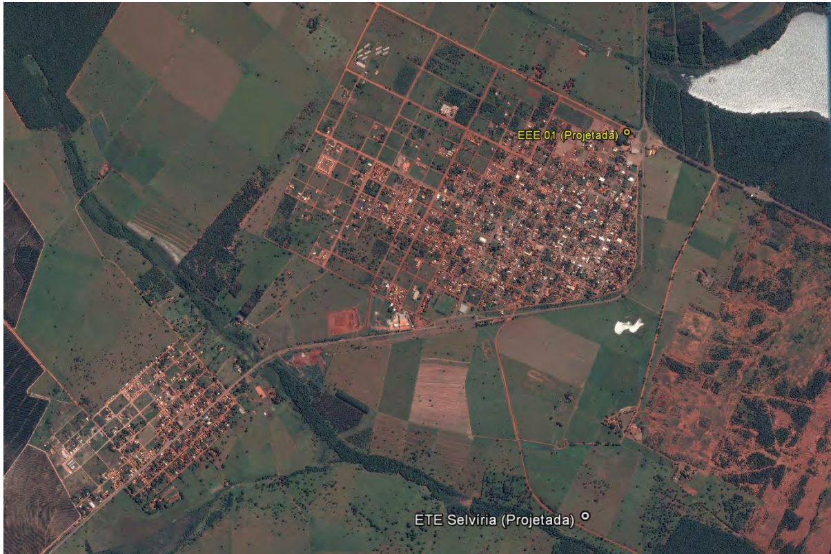
Figura 1: Localização das Unidades Operacionais existentes e projetadas na cidade de Selvíria, MS.

A cidade de Selvíria não possui Sistema de Esgotamento Sanitário (SES), porém possui áreas selecionadas para a implantação de uma Estação de Tratamento de Esgoto (ETE) e uma Estação Elevatória de Esgoto Bruto (EEEB) projetadas (Figura 1).