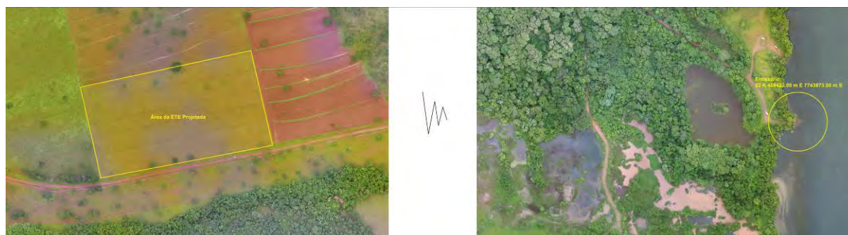
Figura 3: Vista aérea da ETE Selvíria Projetada e entorno, Selvíria, MS.

A ETE Selvíria Projetada, de acordo com o Sistema Interativo de Suporte ao Licenciamento Ambiental (SISLA) de MS, não se sobrepõe a nenhuma Unidade de Conservação ou Zonas de Amortecimento, nem a Terras Indígenas, Áreas de Perambulação, Quilombolas e Assentamentos Rurais (Figura 4).