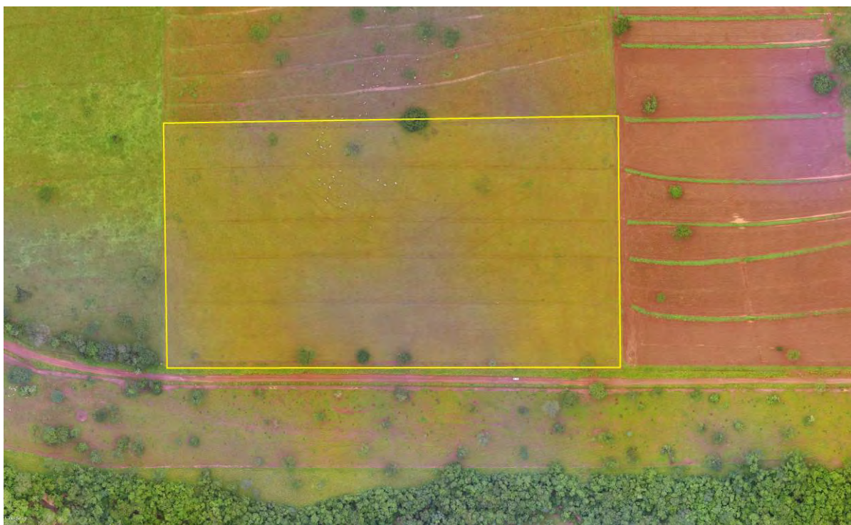
Figura 2: Vista aérea da ETE Selvíria Projetada, Selvíria, MS.