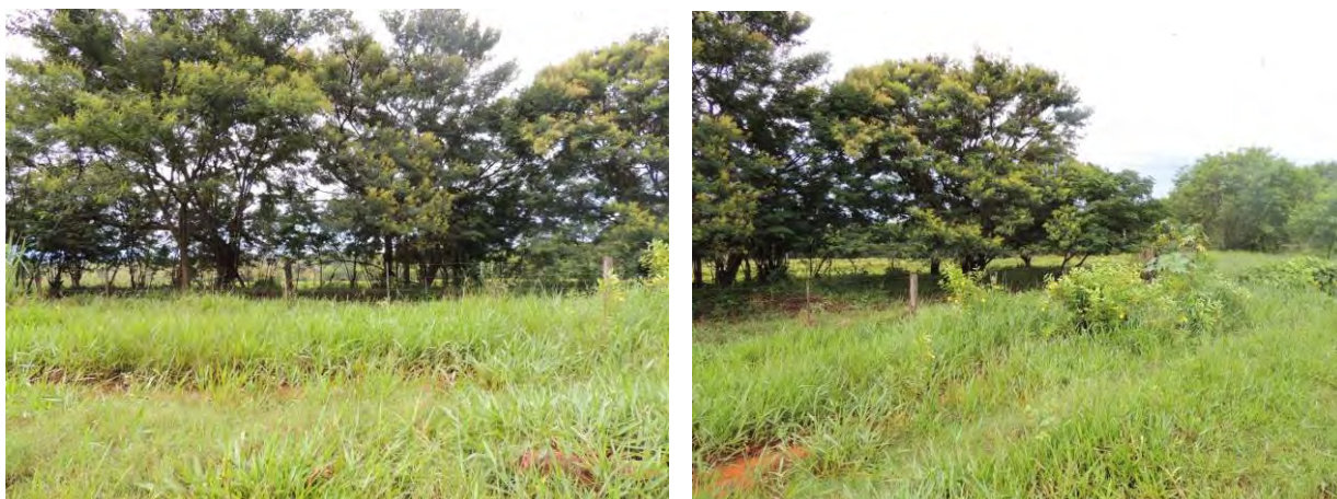
Figura 5: Área prevista para implantação da EEEB 001 Projetada, Selvíria, MS.

A EEEB 001 Projetada, elevatória que terá função de recalque do esgoto bruto para a ETE Selvíria, localiza-se na Alameda 12 com a Rodovia BR-168, coordenadas geográficas UTM (22 K) 456.601 E / 7.748.844 S. A área é recoberta por gramíneas de pastagem e com poucas árvores nativas esparsas (Figura 5). Não possui informações sobre extravasor.