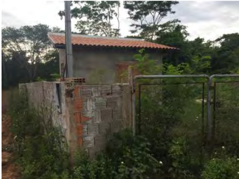
Figura 4: Vista geral da área da EEEB 002 Projetada, Rio Negro, MS.

A EEEB 002 Projetada, de acordo com o Sistema Interativo de Suporte ao Licenciamento Ambiental (SISLA) de MS, não se sobrepõe a nenhuma Unidade de Conservação ou Zonas de Amortecimento, nem a Terras Indígenas, Áreas de Perambulação, Quilombolas e Assentamentos Rurais.