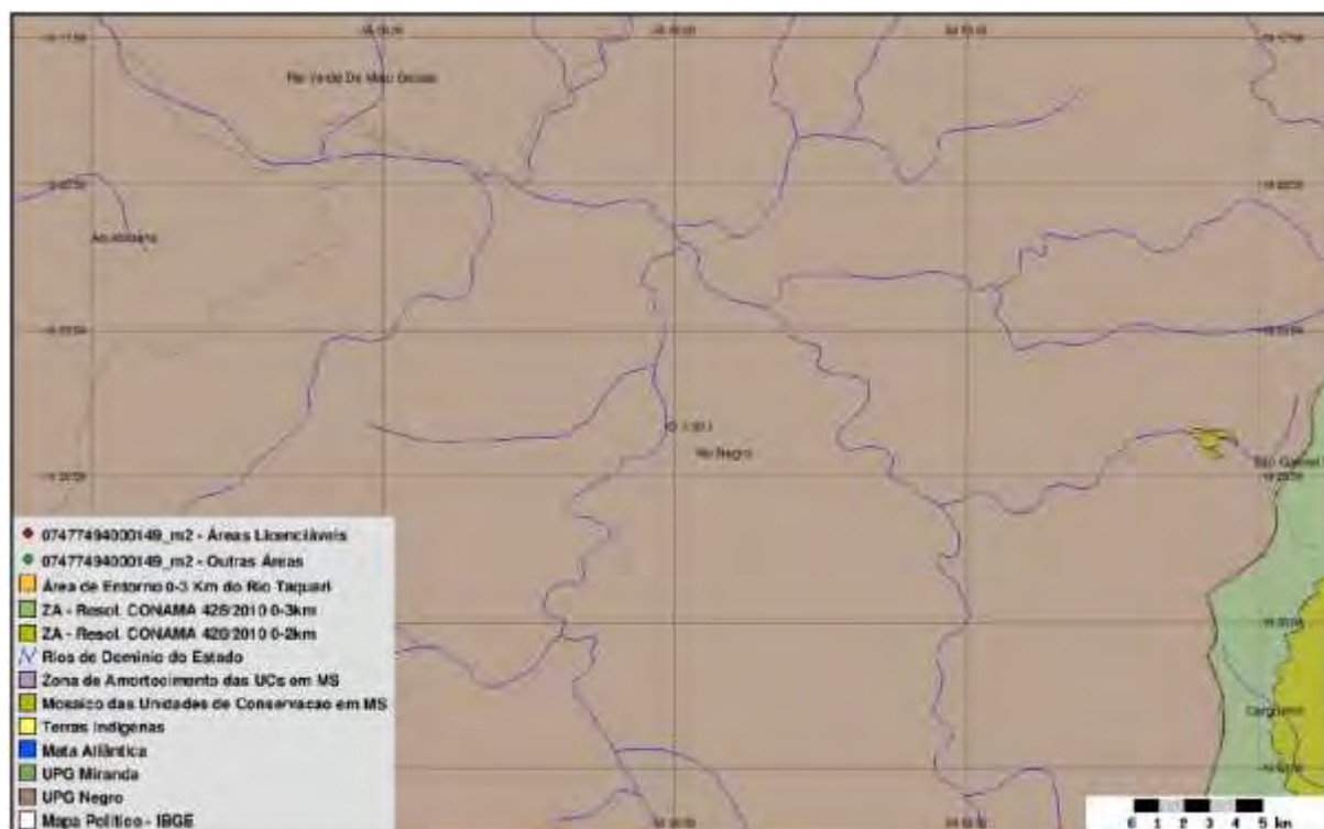
Figura 3: SISLA da ETE Rio Negro Projetada (IMASUL, 2017).