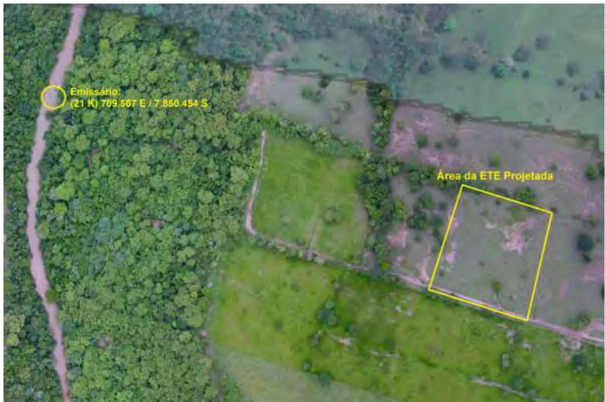
Figura 2: Vista aérea da ETE Rio Negro Projetada e entorno, Rio Negro, MS.

A ETE Rio Negro Projetada, de acordo com o Sistema Interativo de Suporte ao Licenciamento Ambiental (SISLA) de MS, não se sobrepõe a nenhuma Unidade de Conservação ou Zonas de Amortecimento, nem a Terras Indígenas, Áreas de Perambulação, Quilombolas e Assentamentos Rurais (Figura 3).