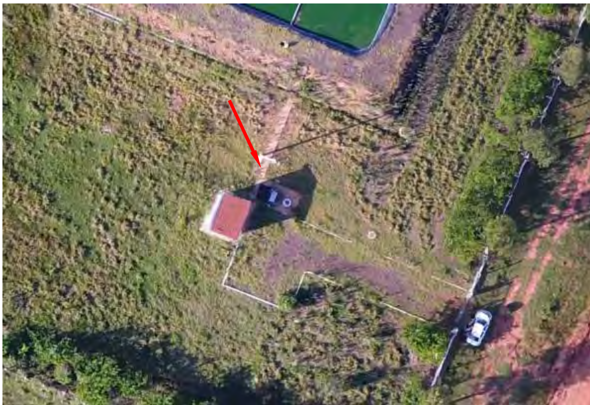
Figura 7: Vista aérea da EEET NEP-ETE, distrito de Nova Esperança, MS.

A EEET NEP-ETE, de acordo com o Sistema Interativo de Suporte ao Licenciamento Ambiental (SISLA) de MS, não se sobrepõe a nenhuma Unidade de Conservação ou Zonas de Amortecimento, nem a Terras Indígenas, Áreas de Perambulação, Quilombolas e Assentamentos Rurais.