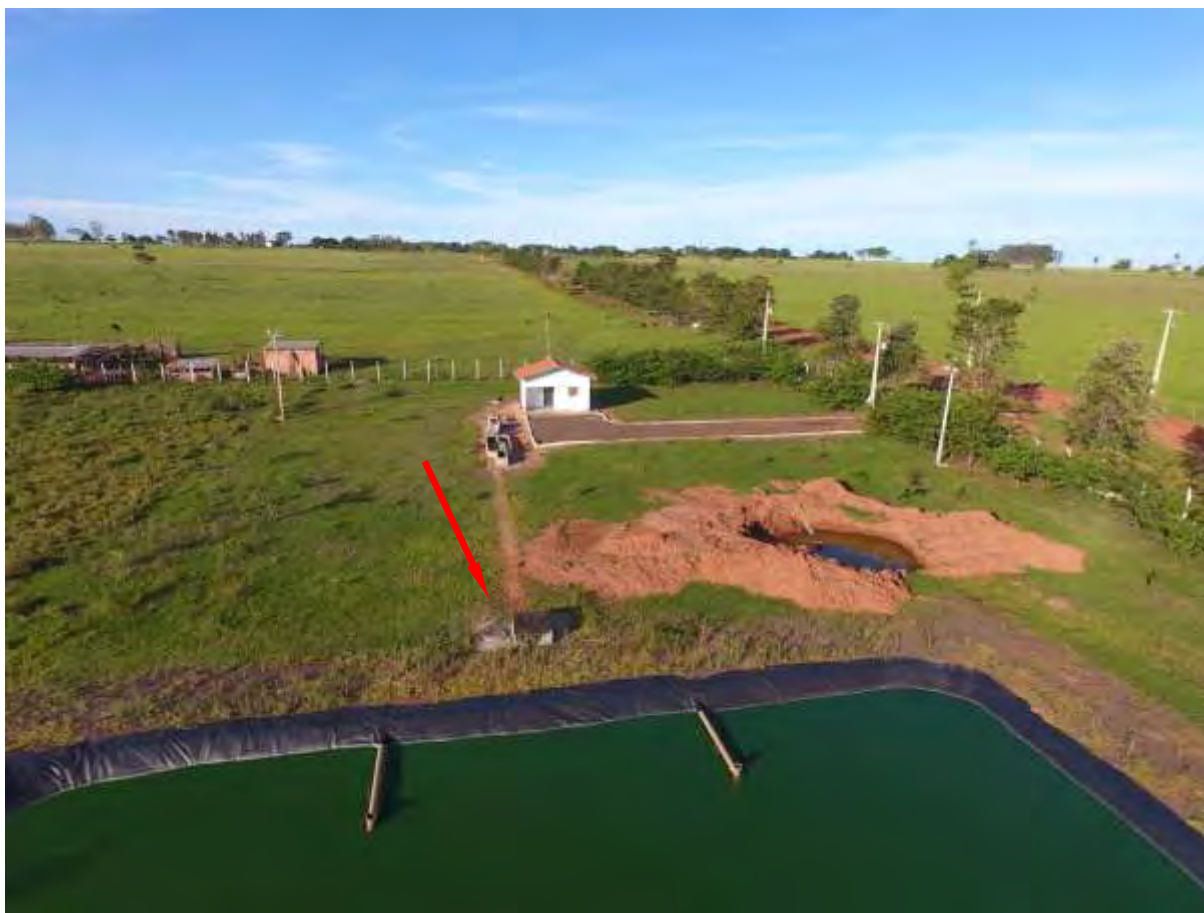
Figura 6: Vista aérea da EEEB 001, distrito de Nova Esperança, MS.

A EEEB 001 localiza-se dentro da ETE Nova Esperança, coordenadas geográficas UTM (22 K) 777.715 E / 7.501.980 S, com a função de retornar o efluente líquido da caixa de areia até o tratamento preliminar. Encontra-se completamente cercada por muro e cercas com arame alambrado e portão com trancas (Figura 6). Não possui informações sobre extravasor.