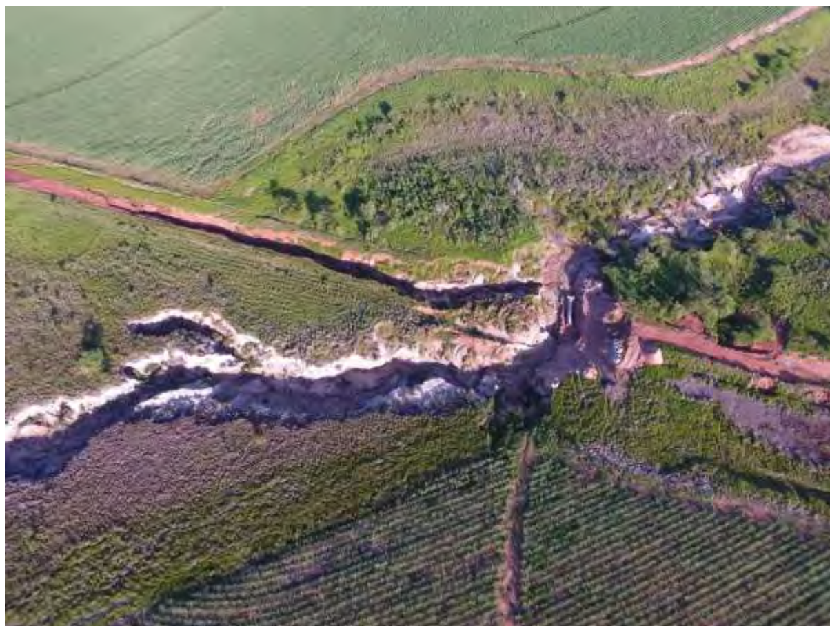
Figura 5: Vista aérea da voçoroca que danificou o emissário da ETE Nova Esperança, distrito de Nova Esperança, MS