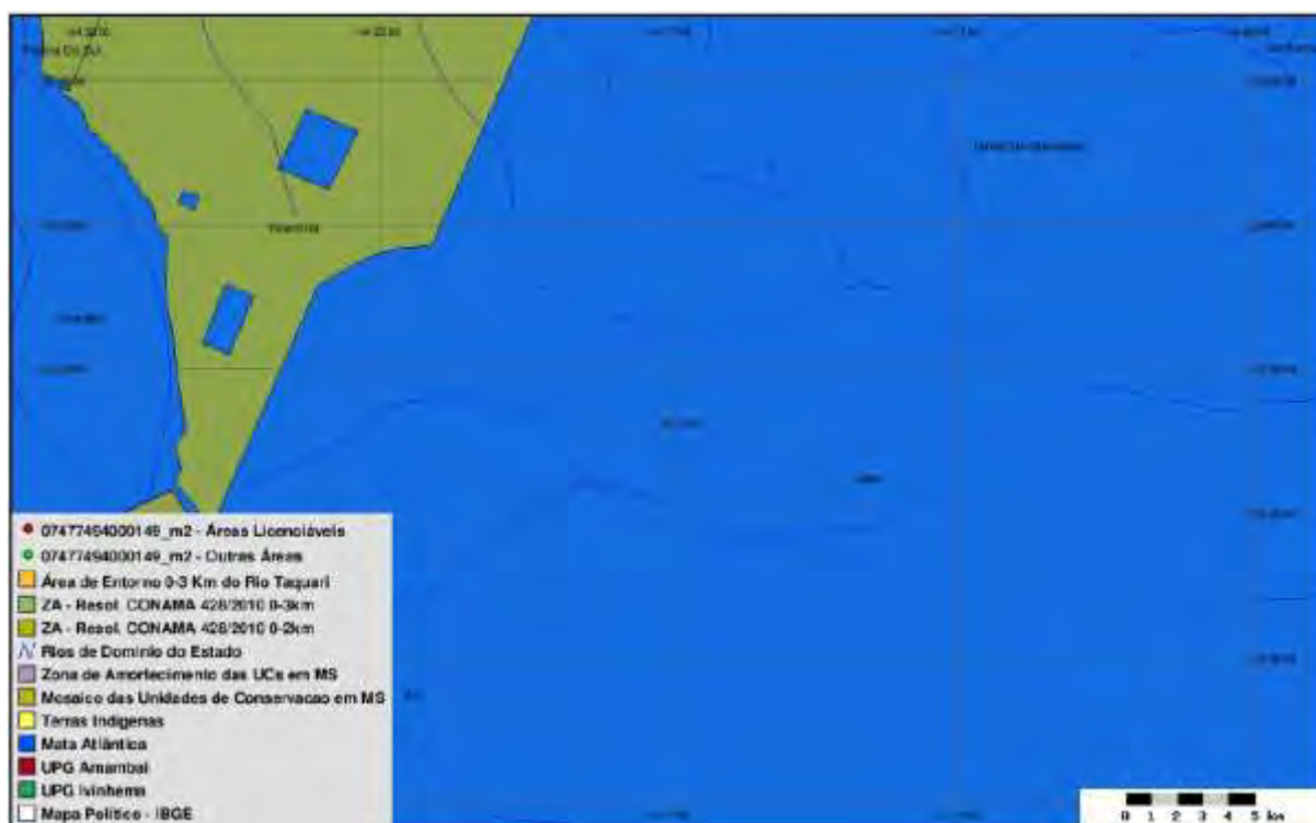
Figura 4: SISLA da ETE Nova Esperança (IMASUL, 2016)