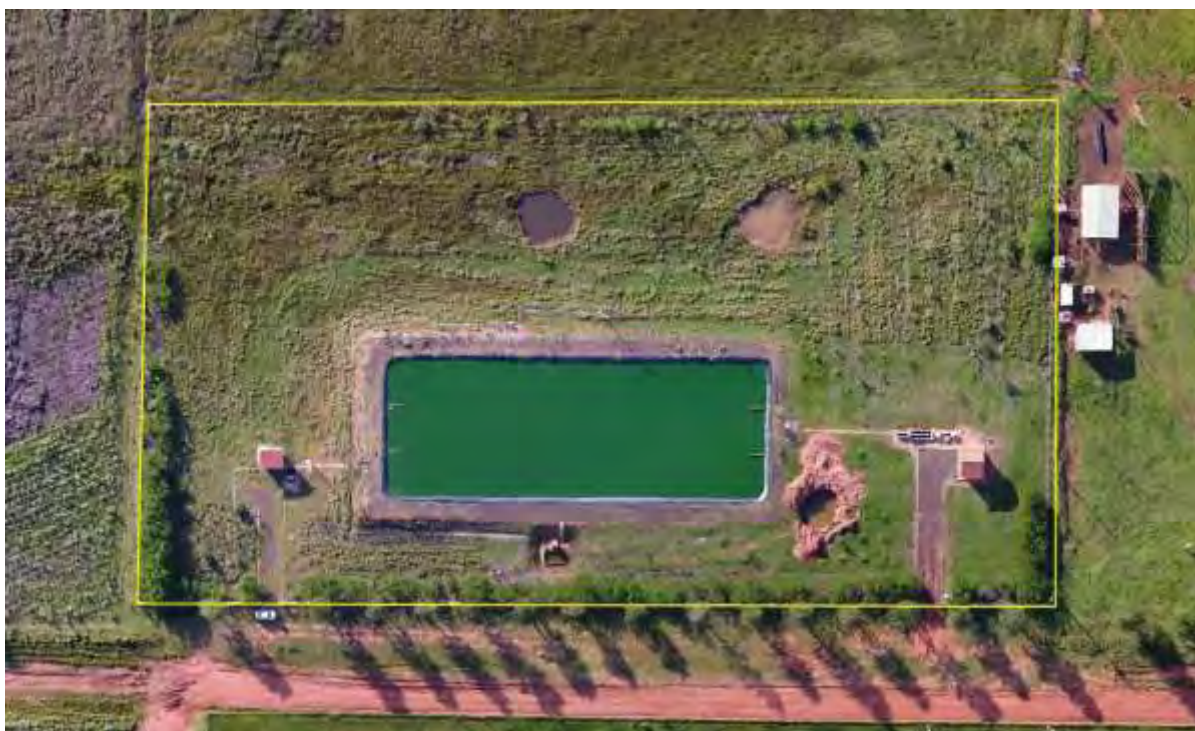
Figura 2: Vista aérea da ETE Nova Esperança, distrito de Nova Esperança, MS.