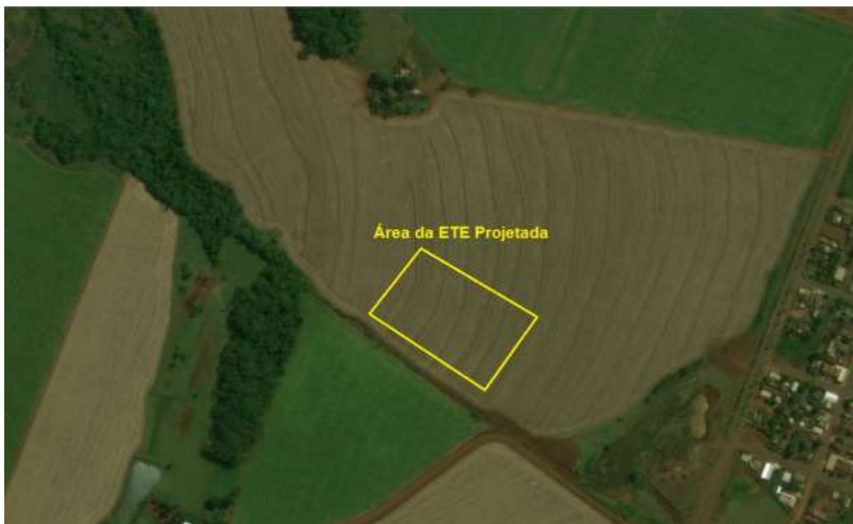
Figura 2: Vista da área pretendida para a ETE Laguna Carapã Projetada, Laguna Carapã, MS.