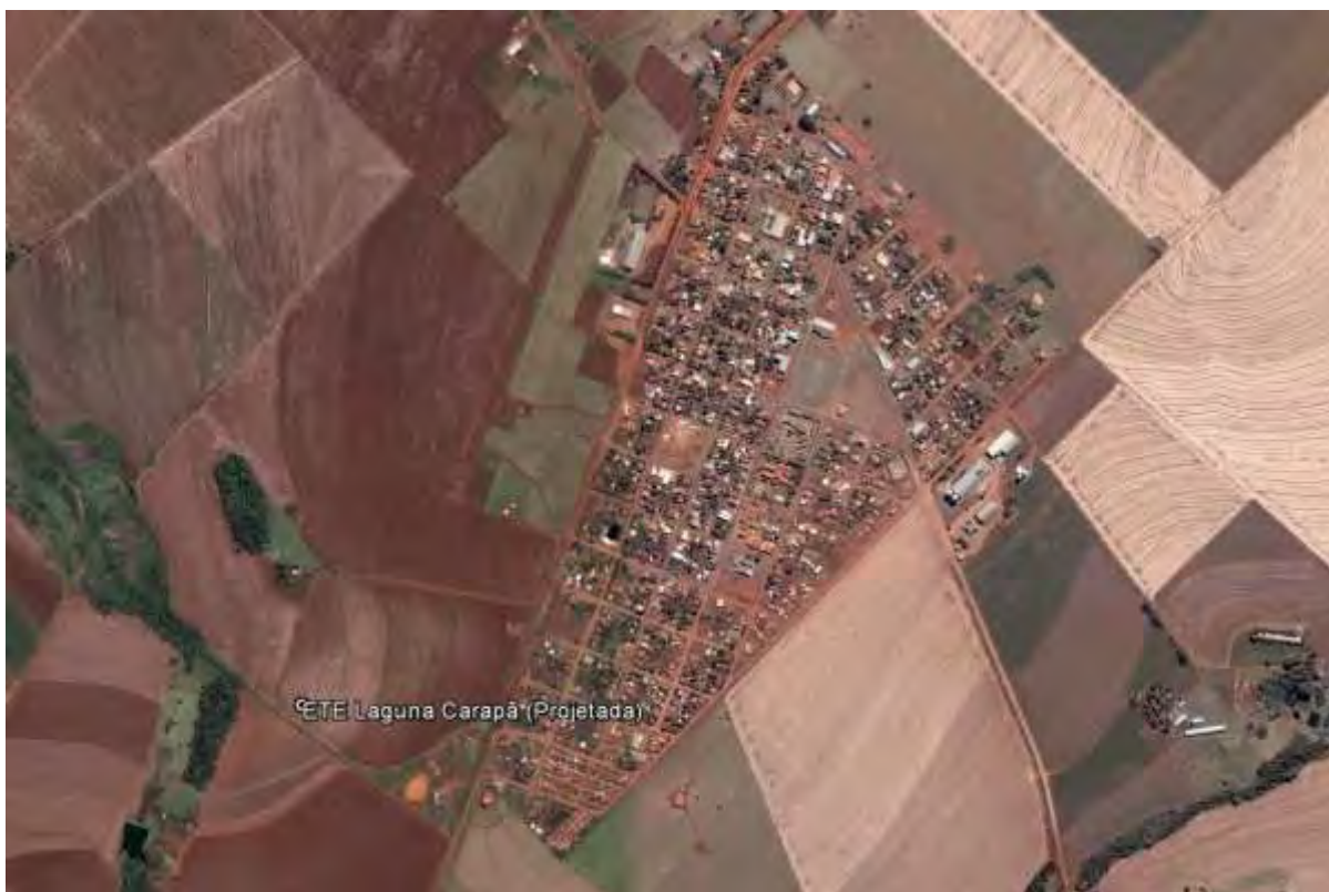
Figura 1: Localização das Unidades Operacionais na cidade de Laguna Carapã, MS.

A cidade de Laguna Carapã não possui Sistema de Esgotamento Sanitário (SES). Porém possui uma área selecionada para a implantação de uma Estação de Tratamento de Esgotos (ETE) projetada (Figura 1). Destaca-se que devido à topografia da cidade não é necessária à implantação de Estações Elevatórias de Esgoto Bruto (EEEB).