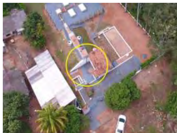
Figura 5: Vista geral da ETE 001, Anastácio, MS.

A ETE 001, de acordo com o Sistema Interativo de Suporte ao Licenciamento Ambiental (SISLA) de MS, se sobrepõe à Zona de Amortecimento (0 a 3 km; Resoluções CONAMA nº 428/2010 e nº 473/2015) do Parque Natural Municipal da Lagoa Comprida localizada no município de Aquidauana, Unidade de Conservação de Proteção Integral e sem Plano de Manejo estabelecido.