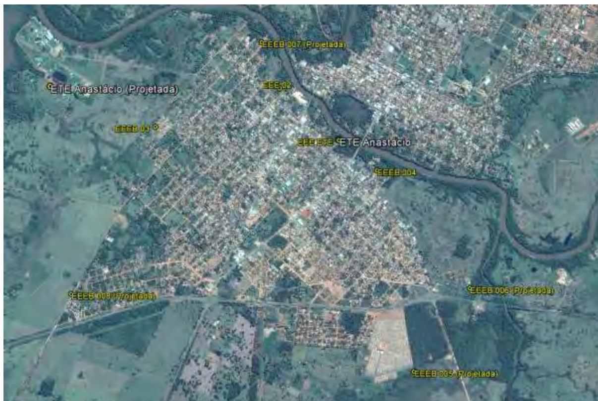
Figura 1: Localização das Unidades Operacionais existentes e projetadas na cidade de Anastácio, MS.

A cidade de Anastácio possui uma Estação de Tratamento de Esgotos (ETE) e quatro Estações Elevatórias de Esgoto Bruto (EEEB), todas em operação. Possui, ainda, áreas selecionadas para a implantação de uma Estação de Tratamento de Esgotos (ETE) e de quatro Estações Elevatórias de Esgoto Bruto (EEEB) projetadas (Figura 1).