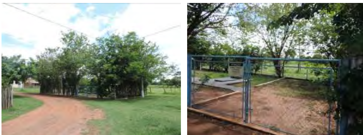
Figura 7: Vista geral da EEEB 003, Anastácio, MS.

A EEEB 003 localiza-se na Rua 18 de Março, coordenadas geográficas UTM (21 K) 623.199 E / 7.734.795 S, completamente cercada por cerca com alambrado e portão com trancas para veículos. Possui cortina arbórea e tem como função recalcar o esgoto afluyente para a EEEB 002 (Figura 9). Não possui informação sobre extravasor.