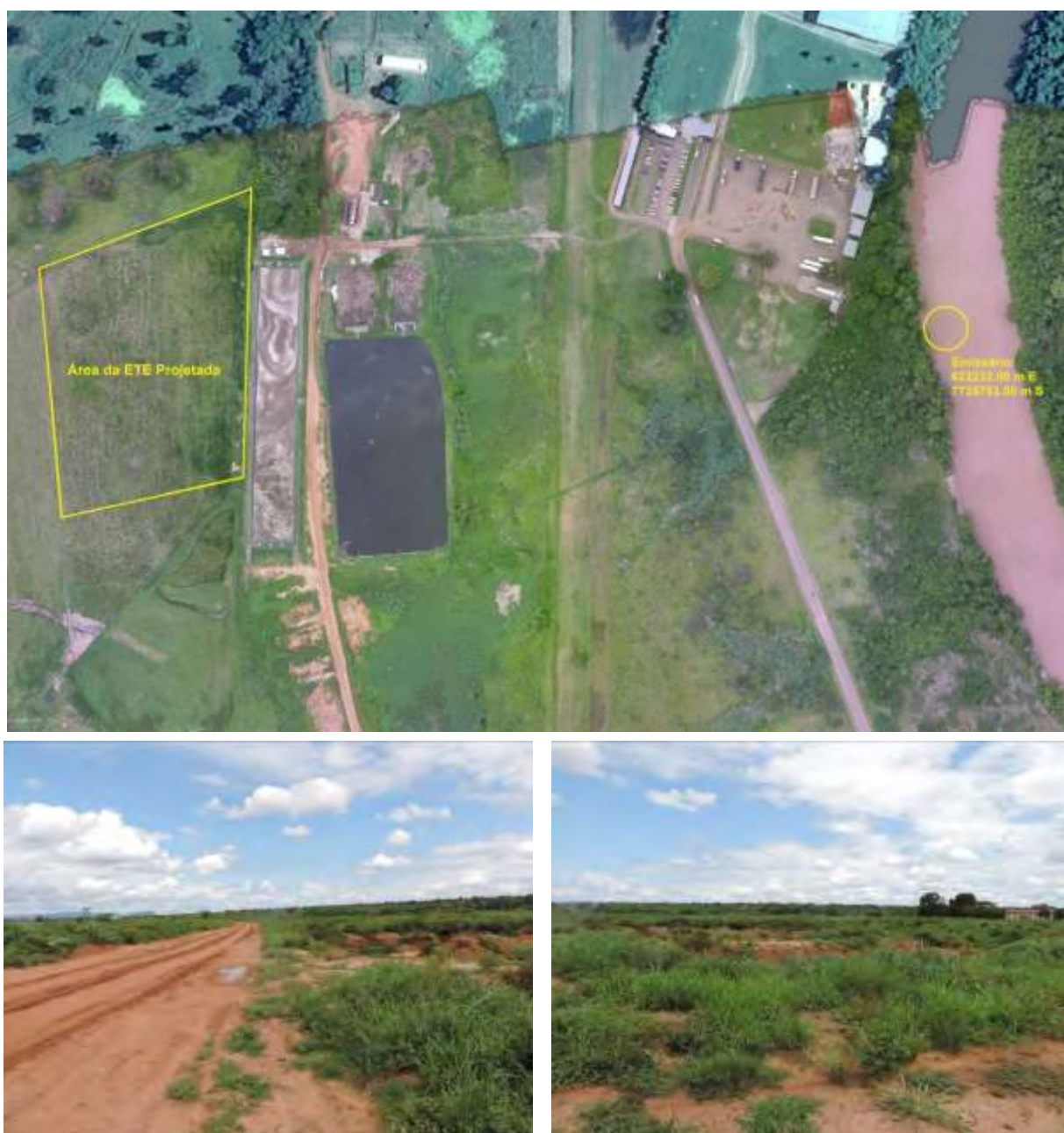
Figura 9: Vista da área pretendida da ETE Anastácio Projetada, Anastácio, MS.

A ETE Anastácio Projetada, de acordo com o Sistema Interativo de Suporte ao Licenciamento Ambiental (SISLA) de MS, não se sobrepõe a nenhuma Unidade de Conservação ou Zonas de Amortecimento, nem a Terras Indígenas, Áreas de Perambulação, Quilombolas e Assentamentos Rurais (Figura 6).