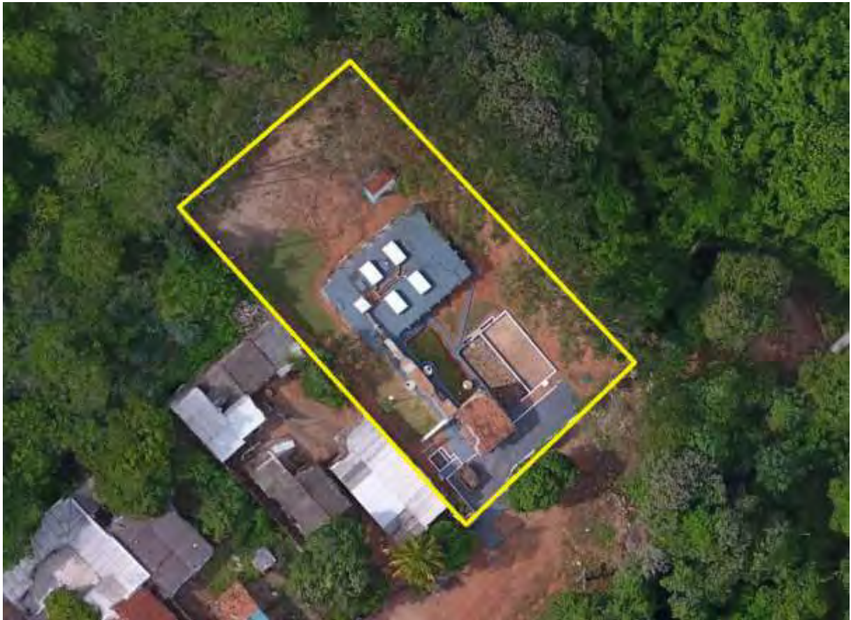
Figura 2: Vista aérea da ETE Anastácio, Anastácio, MS.