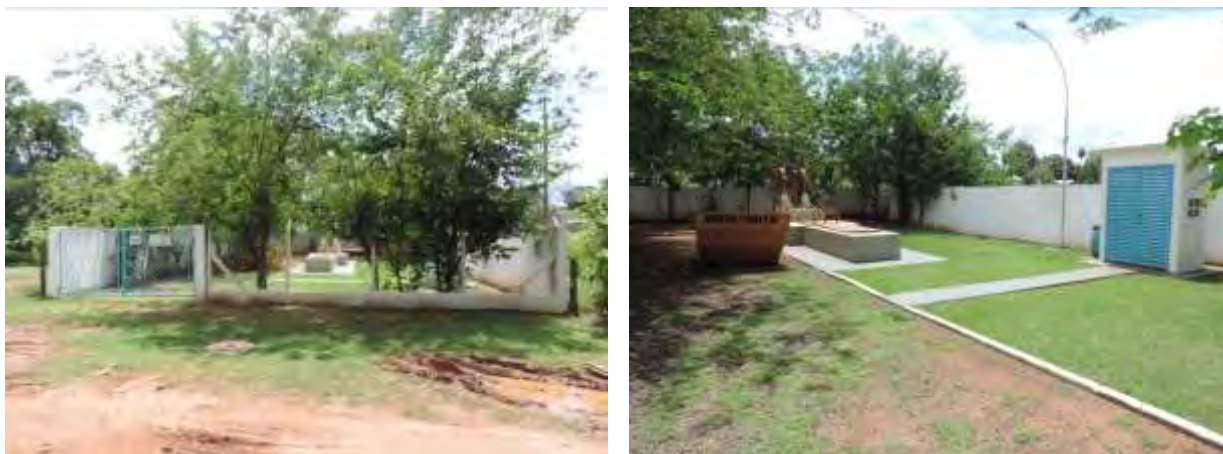
Figura 6: Vista geral da EEEB 002, Anastácio, MS.

A EEEB 002 localiza-se na Rua Bomfim esquina com Porto Geral, coordenadas geográficas UTM (21 K) 624.633 E / 7.735.219 S, completamente cercada por muros e na fachada cerca com alambrado e portão com trancas para veículos. Não possui cortina arbórea e tem como função recalcar o esgoto afluyente para a EEEB ETE (Figura 8). Não possui informação sobre extravasor.