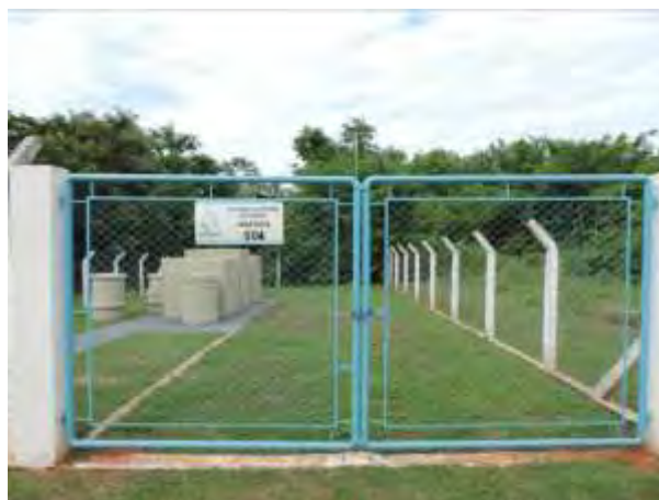
Figura 8: Vista geral da EEEB 004, Anastácio, MS.