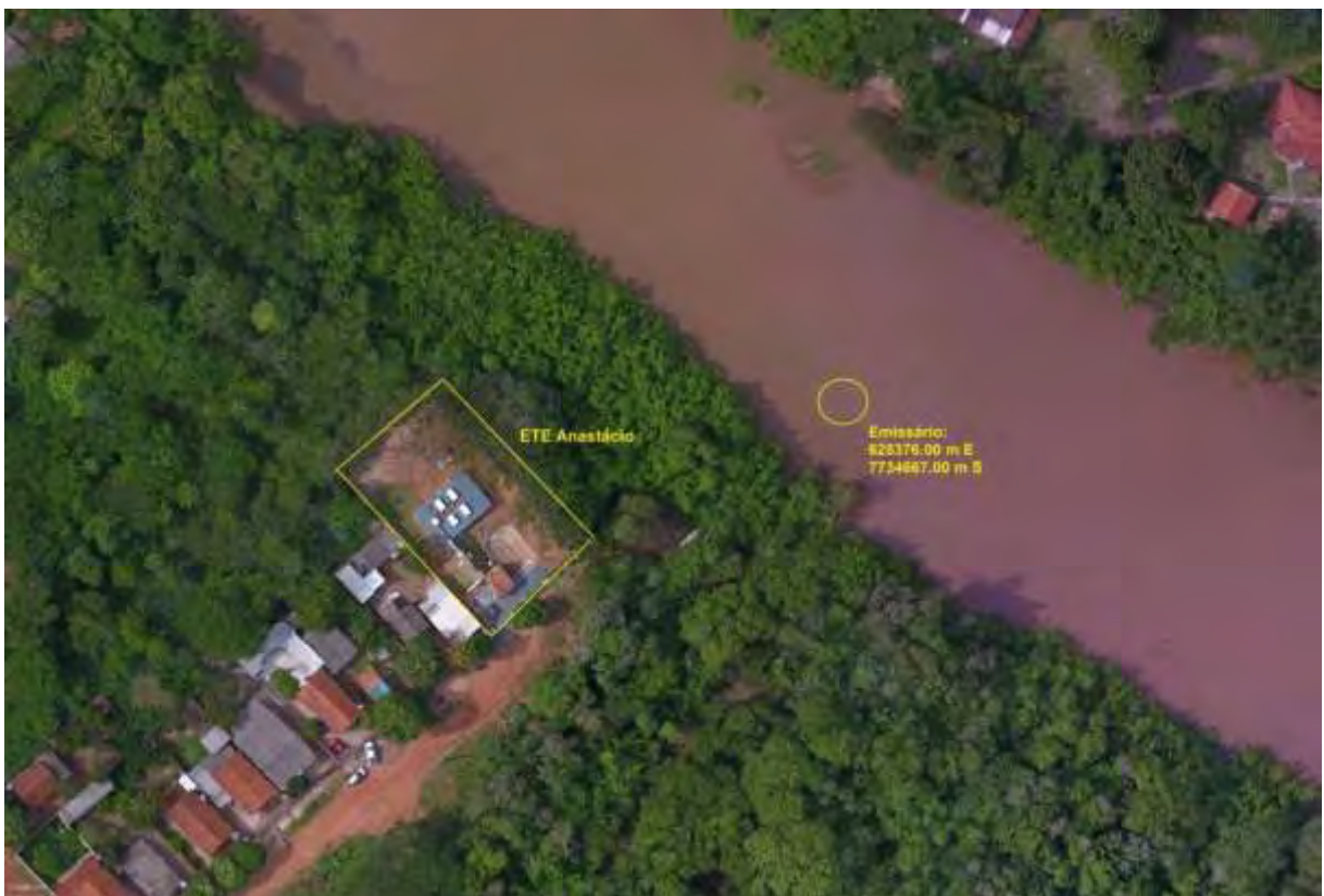
Figura 3: Vista aérea da ETE Anastácio e entorno, Anastácio, MS.