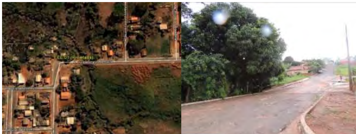
Figura 9: Vista geral da EEEB 001 Projetada, Inocência, MS.

A EEEB 001 Projetada, de acordo com o Sistema Interativo de Suporte ao Licenciamento Ambiental (SISLA) de MS, não se sobrepõe a nenhuma Unidade de Conservação ou Zonas de Amortecimento, nem a Terras Indígenas, Áreas de Perambulação, Quilombolas e Assentamentos Rurais.