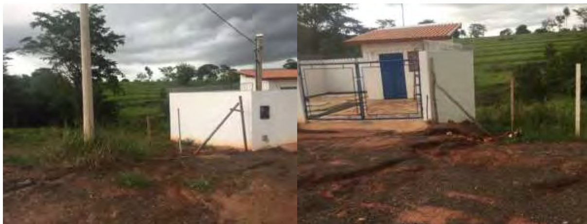
Figura 7: Registro de passivos ambientais na EEEB 006, Inocência, MS.

Não foram identificados passivos ambientais decorrentes de vazamento e acondicionamento de resíduos sólidos. Entretanto, há pequenos processos erosivos instalados na entrada e na lateral da EEEB 006 (Figura 7).