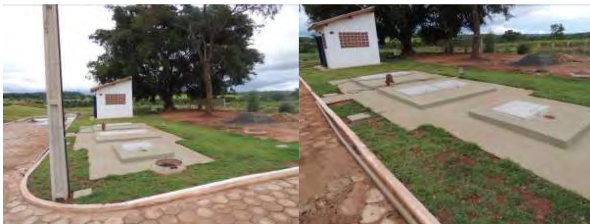
Figura 8: Vista geral da EEEB 007, Inocência, MS.

A EEEB 007, de acordo com o Sistema Interativo de Suporte ao Licenciamento Ambiental (SISLA) de MS, se sobrepõe a Área de Proteção Ambiental Municipal da Sub-bacia do rio Sucuriú, mas não a Terras Indígenas, Áreas de Perambulação, Quilombolas e Assentamentos Rurais.