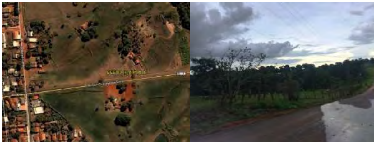
Figura 11: Vista geral da EEEB 003 Projetada, Inocência, MS.

A EEEB 003 Projetada, de acordo com o Sistema Interativo de Suporte ao Licenciamento Ambiental (SISLA) de MS, não se sobrepõe a nenhuma Unidade de Conservação ou Zonas de Amortecimento, nem a Terras Indígenas, Áreas de Perambulação, Quilombolas e Assentamentos Rurais.