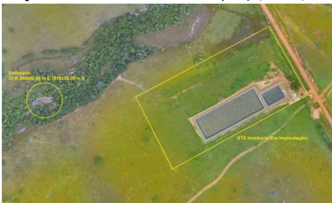
Figura 3: Vista aérea da ETE Inocência em implantação e entorno, Inocência, MS.