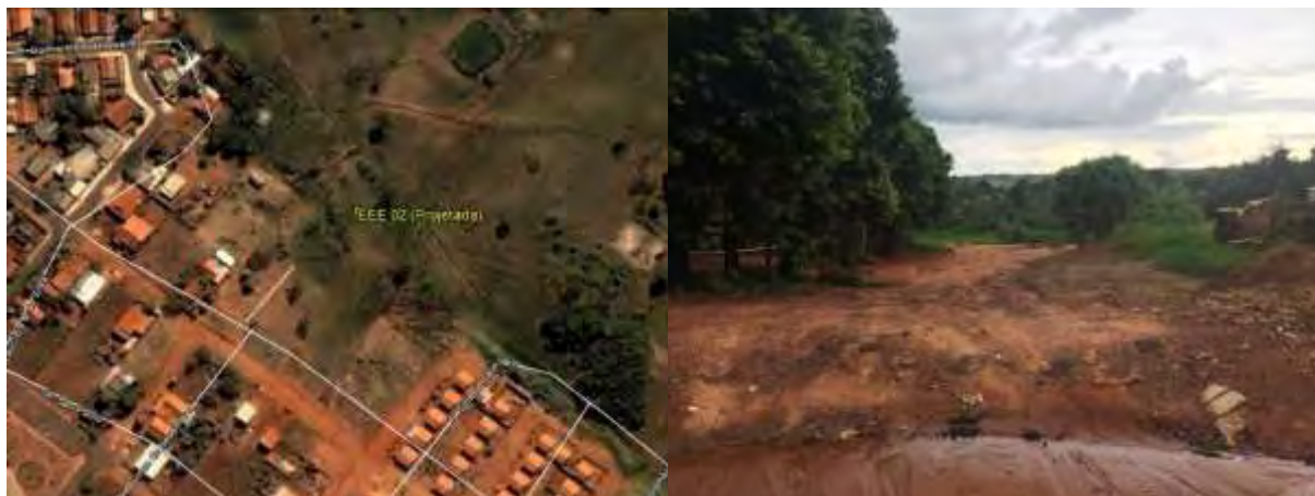
Figura 10: Vista geral da EEEB 002 Projetada, Inocência, MS.

A EEEB 002 Projetada, de acordo com o Sistema Interativo de Suporte ao Licenciamento Ambiental (SISLA) de MS, não se sobrepõe a nenhuma Unidade de Conservação ou Zonas de Amortecimento, nem a Terras Indígenas, Áreas de Perambulação, Quilombolas e Assentamentos Rurais.