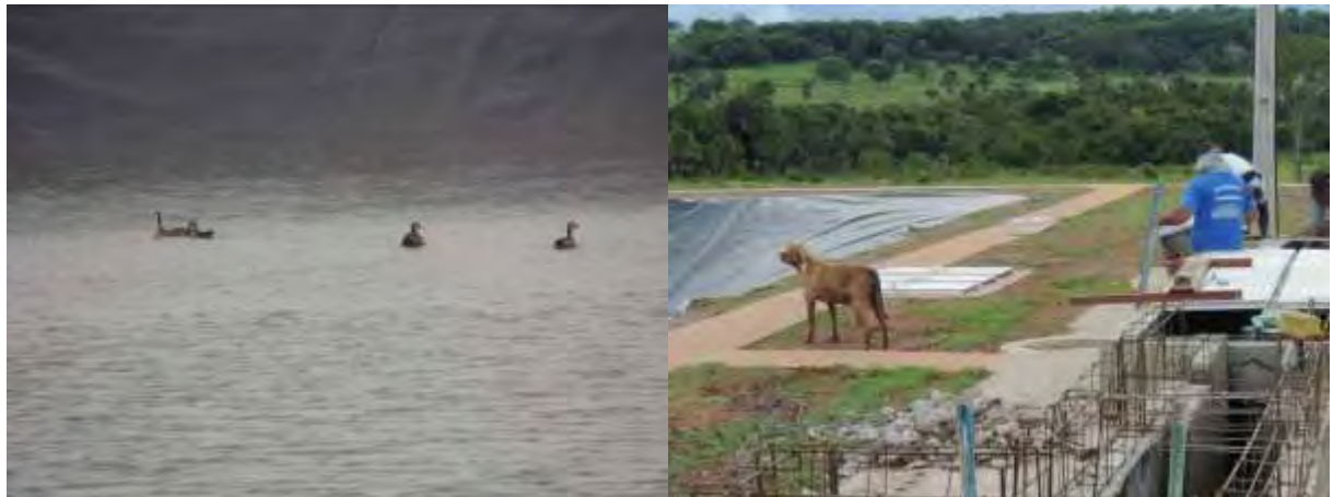
Figura 5: Registro de animais silvestres e domésticos na ETE Inocência, Inocência, MS.

Não há geração de resíduos sólidos, pois a ETE ainda não está em operação. Prevê-se que os resíduos sólidos a serem gerados no gradeamento serão, juntamente com o lodo desidratado no leito de secagem, enviados para a área de disposição final de resíduos sólidos (lixão) de Inocência.