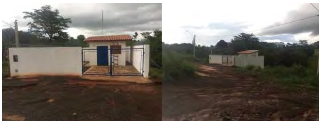
Figura 6: Vista geral da EEEB 006, Inocência, MS.

A EEEB 006, de acordo com o Sistema Interativo de Suporte ao Licenciamento Ambiental (SISLA) de MS, não se sobrepõe a nenhuma Unidade de Conservação ou Zonas de Amortecimento, Terras Indígenas, Áreas de Perambulação, Quilombolas e Assentamentos Rurais.