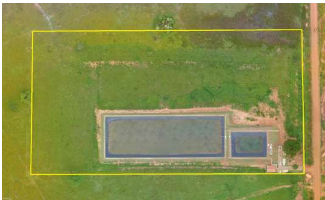
Figura 2: Acima: Vista aérea da ETE Inocência em implantação, Inocência, MS.

A ETE Inocência, em implantação, está localizada no limite da zona urbana de Inocência na rodovia MS-316, saída para Paraíso das Águas, coordenadas geográficas UTM (22 K) 398.807 E / 7.818.590 S, distante 160 m do corpo receptor. Encontra-se cercada por alambrado e portão com tranca na fachada. A área contém algumas árvores esparsas e não apresenta cortina arbórea (Figuras 2 e 3).