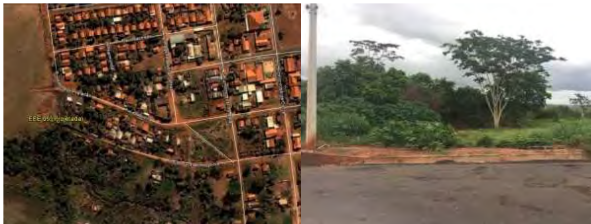
Figura 13: Vista geral da EEEB 005 Projetada, Inocência, MS.

A EEEB 005 Projetada, de acordo com o Sistema Interativo de Suporte ao Licenciamento Ambiental (SISLA) de MS, não se sobrepõe a nenhuma Unidade de Conservação ou Zonas de Amortecimento, nem a Terras Indígenas, Áreas de Perambulação, Quilombolas e Assentamentos Rurais.