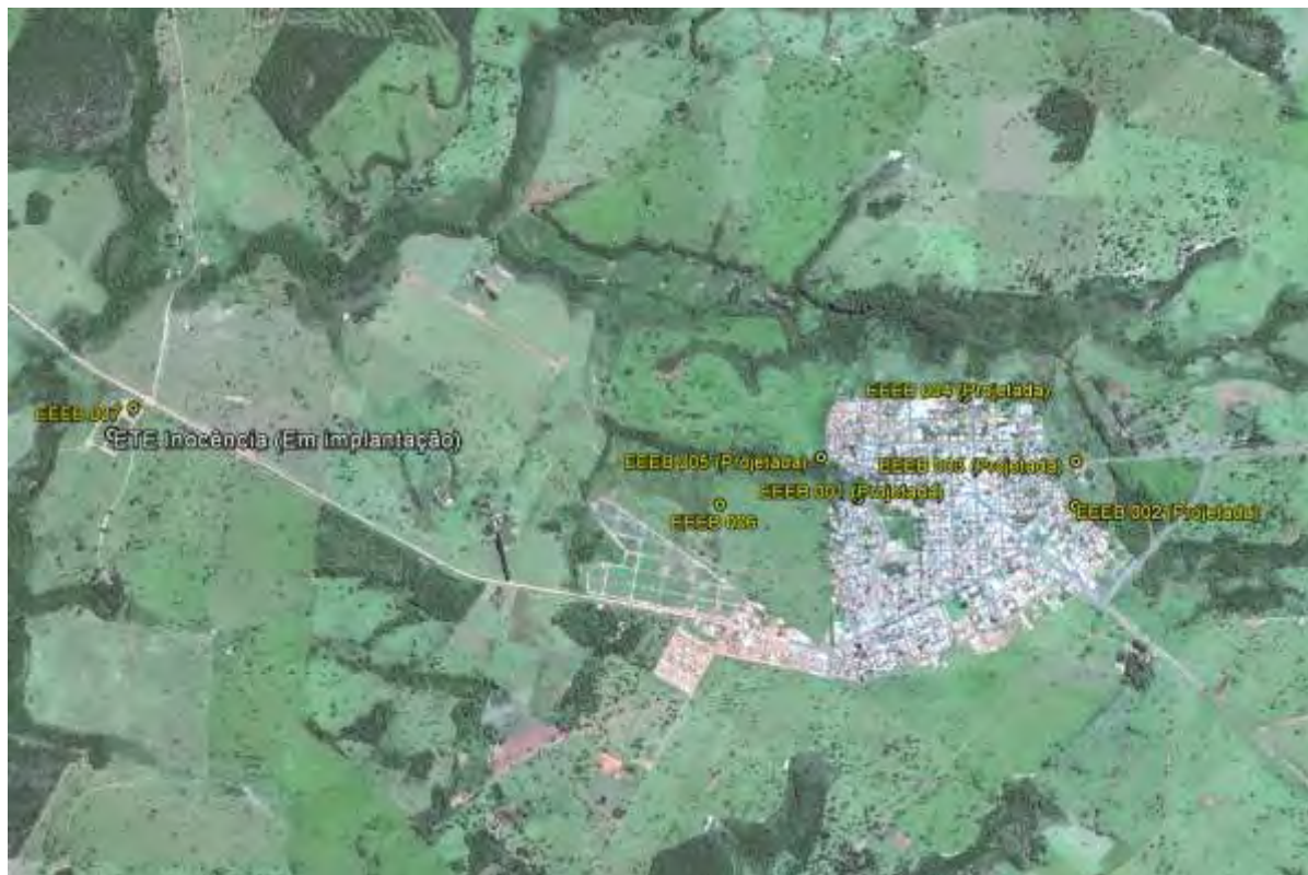
Figura 1: Localização das Unidades Operacionais existentes e projetadas na cidade de Inocência, MS.

A cidade de Inocência possui uma Estação de Tratamento de Esgotos (ETE) em implantação e duas Estações Elevatórias de Esgoto Bruto (EEEB) implantadas, mas não em operação. Possui, ainda, áreas selecionadas para a implantação de cinco Estações Elevatórias de Esgoto Bruto (EEEB) projetadas (Figura 1).