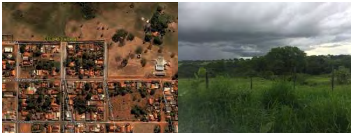
Figura 12: Vista geral da EEEB 004 Projetada, Inocência, MS.

A EEEB 004 Projetada, de acordo com o Sistema Interativo de Suporte ao Licenciamento Ambiental (SISLA) de MS, não se sobrepõe a nenhuma Unidade de Conservação ou Zonas de Amortecimento, nem a Terras Indígenas, Áreas de Perambulação, Quilombolas e Assentamentos Rurais.