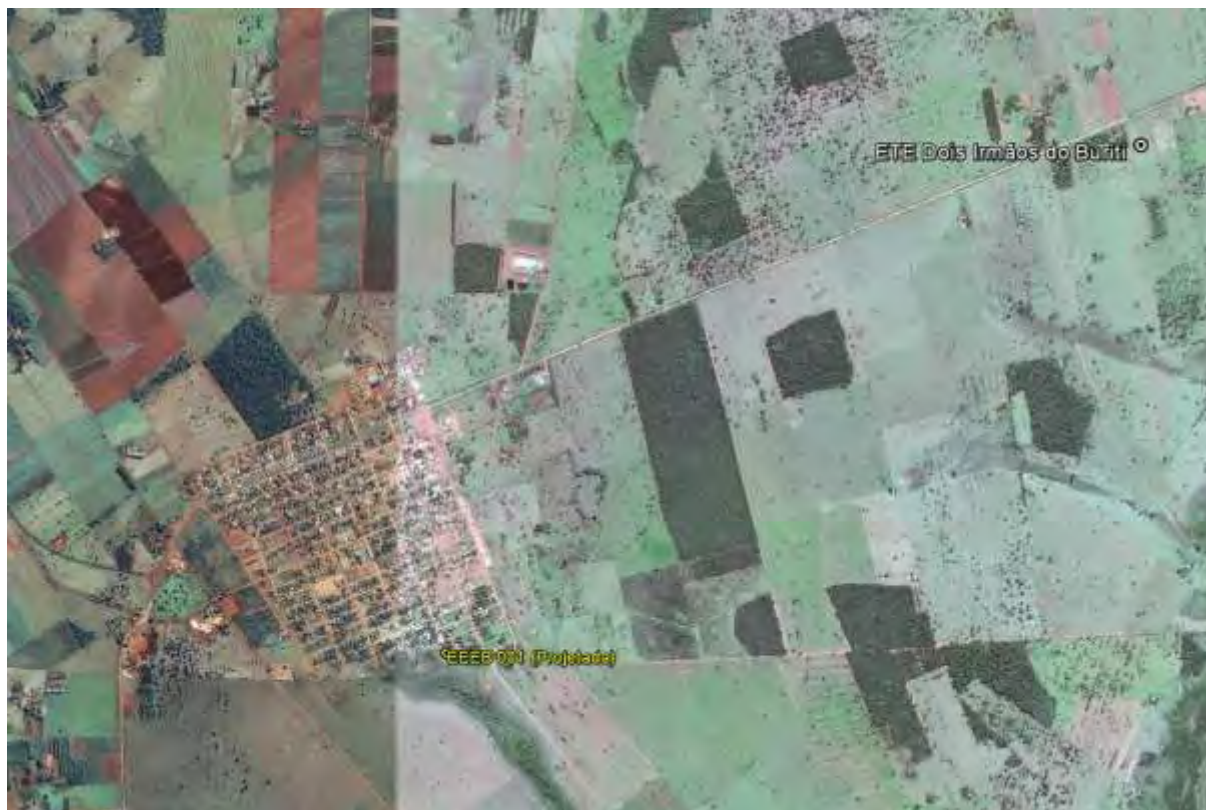
Figura 1: Localização das Unidades Operacionais existentes e projetadas na cidade de Dois Irmãos do Buriti, MS.

A cidade de Dois Irmãos do Buriti possui uma Estação de Tratamento de Esgotos (ETE) implantada, mas que ainda não entrou em operação. Possui, ainda, área selecionada para a implantação de uma Estação Elevatória de Esgoto Bruto (EEEB) projetada (Figura 1).