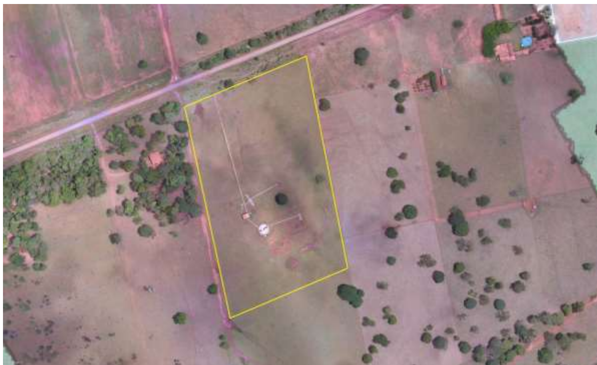
Figura 2: Vista aérea da ETE Dois Irmãos do Buriti, Dois Irmãos do Buriti, MS.

A ETE Dois Irmãos do Buriti está localizada na zona rural de Dois Irmãos do Buriti no final da Avenida Reginaldo Leme da Silva, Rodovia MS 355, coordenadas geográficas UTM (21 K) 684.168 E / 7.713.351 S, distante 1.900 m do corpo receptor. Encontra-se totalmente cercada, com poucas árvores em seu interior e sem cortina arbórea no entorno (Figuras 2 e 3).