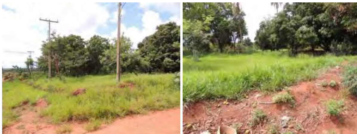
Figura 6: Área prevista para implantação da EEEB 001 Projetada, Dois Irmãos do Buriti, MS.

A EEEB 001 Projetada, elevatória que terá função de recalque do esgoto bruto para a ETE Dois Irmãos do Buriti, localiza-se na Rua Rondonópolis com a Rua Gerônima Teixeira Ramos, coordenadas geográficas UTM (21 K) 680.015 E / 7.710.432 S. A área encontra-se aberta, sem cerca (Figura 6). Não possui informações sobre extravasor.