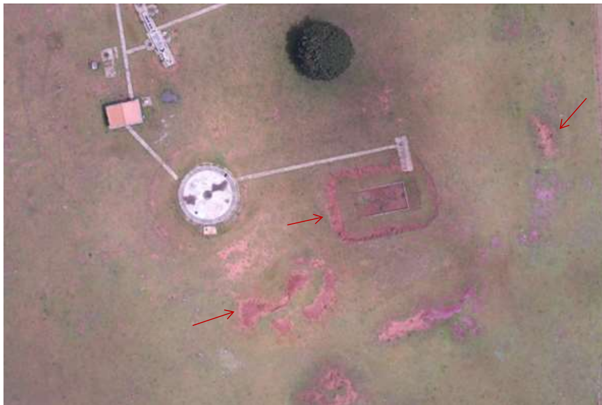
Figura 5: Solo exposto e início de processo erosivo no talude do leito de secagem na área da ETE Dois Irmãos do Buriti, Dois Irmãos do Buriti, MS.

Não foram identificados passivos ambientais decorrentes de vazamento e de acondicionamento de resíduos sólidos na área da ETE Dois Irmãos do Buriti, porém foi identificado início de processo erosivo no talude do leito de secagem, sendo possível verificar os sulcos da erosão e o solo exposto (Figura 5).