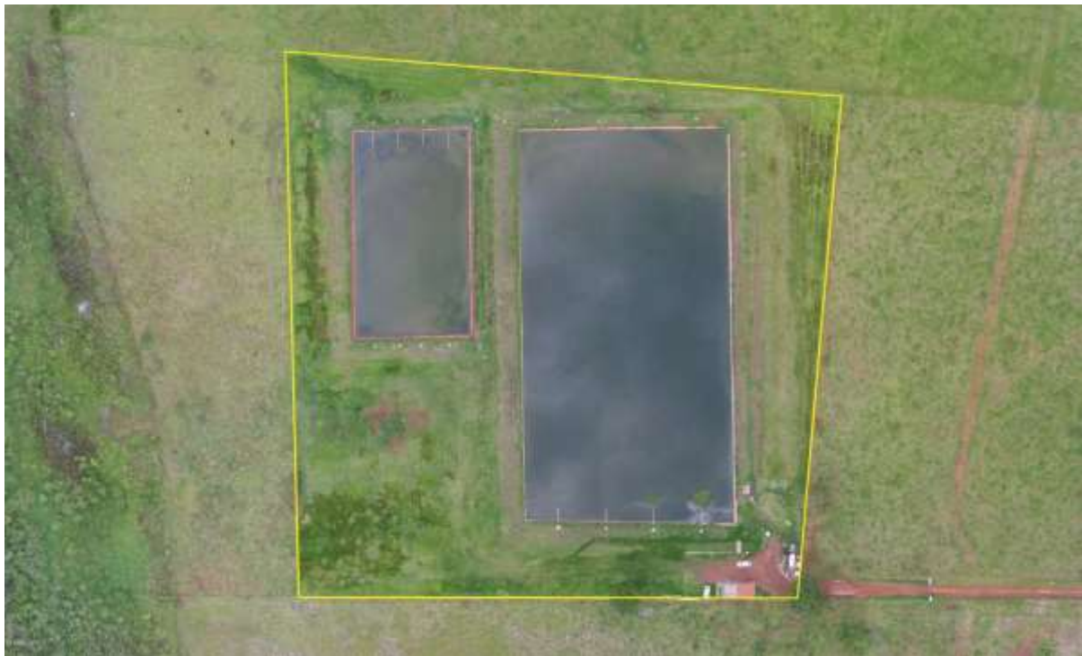
Figura 2: Vista aérea da ETE Caarapó, Caarapó, MS.