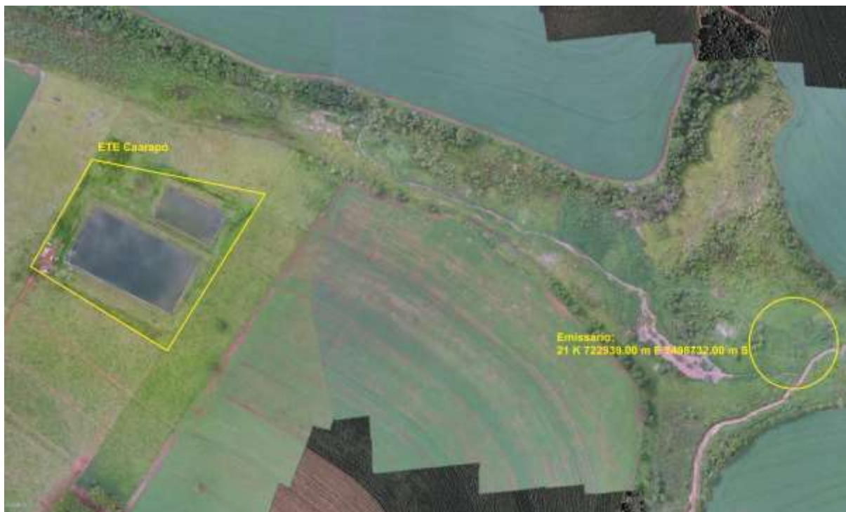
Figura 3: Vista aérea da ETE Caarapó e entorno, Caarapó, MS.

A ETE Caarapó, de acordo com o Sistema Interativo de Suporte ao Licenciamento Ambiental (SISLA) de MS, não se sobrepõe a nenhuma Unidade de Conservação ou Zonas de Amortecimento, nem a Terras Indígenas, Áreas de Perambulação, Quilombolas e Assentamentos Rurais (Figura 4).