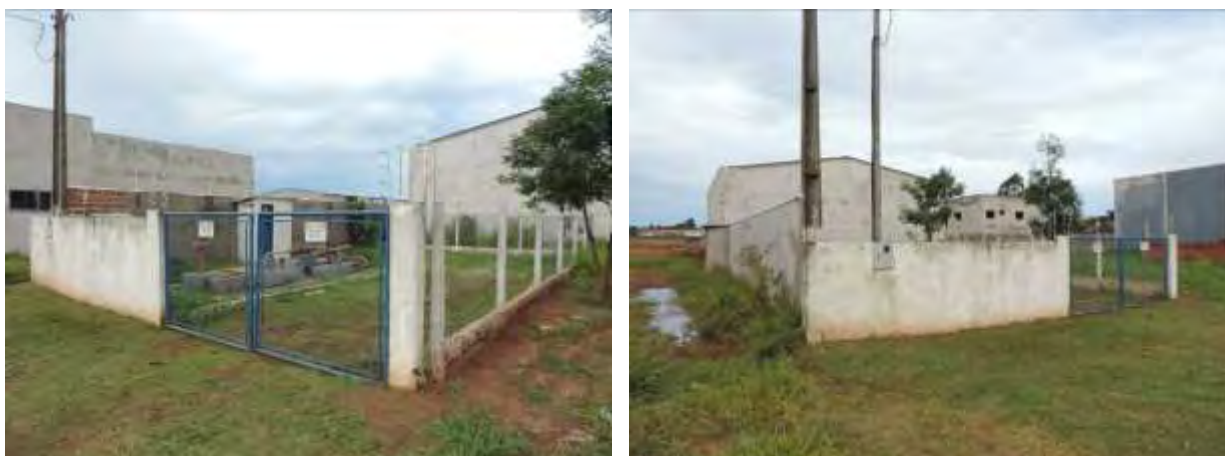
Figura 5: Vista geral da EEEB 001, Caarapó, MS.

A EEEB 001, de acordo com o Sistema Interativo de Suporte ao Licenciamento Ambiental (SISLA) de MS, não se sobrepõe a nenhuma Unidade de Conservação ou suas Zonas de Amortecimento, nem a Terras Indígenas, Áreas de Perambulação, Quilombolas e Assentamentos Rurais.