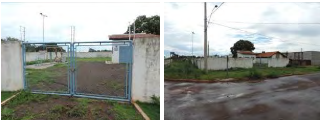
Figura 6: Vista geral da EEEB 002, Caarapó, MS.

A EEEB 002 localiza-se na Rua Arcenio Cardoso esquina com a Rua Sergipe, coordenadas geográficas UTM (21 K) 724.597 E / 7.494.497 S, tendo como função recalcar o esgoto afluente para rede que segue por gravidade até a ETE Caarapó. Encontra-se completamente cercada por alambrado e portão com trancas para veículos (Figura 6). Possui extravasor.