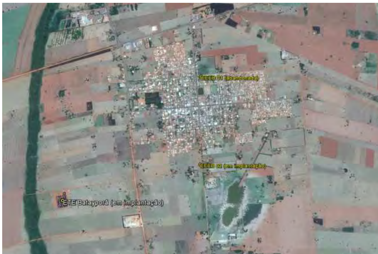
Figura 1: Localização das Unidades Operacionais existentes e projetadas na cidade de Batayporã, MS.

A cidade de Batayporã possui uma Estação de Tratamento de Esgoto (ETE) e uma Estação Elevatória de Esgoto Bruto (EEEB), ambas em implantação. Possui, ainda, uma Estação Elevatória de Esgoto Bruto (EEEB) implantada, mas não em operação (Figura 1). Não possui Unidades Operacionais projetadas.