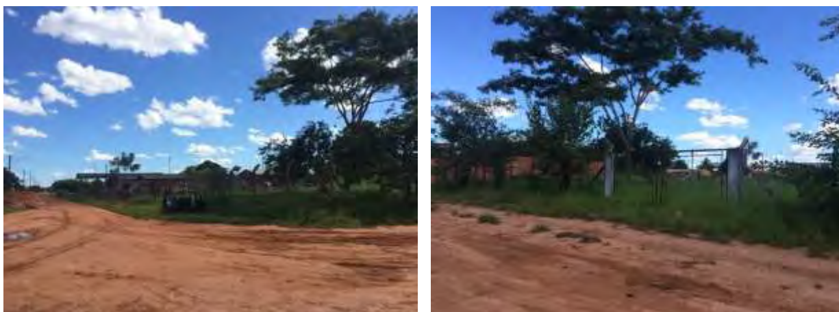
Figura 5: Vista geral da EEEB 001, Batayporã, MS.

A EEEB 001, de acordo com o Sistema Interativo de Suporte ao Licenciamento Ambiental (SISLA) de MS, não se sobrepõe a nenhuma Unidade de Conservação ou Zonas de Amortecimento, nem a Terras Indígenas, Áreas de Perambulação, Quilombolas e Assentamentos Rurais.