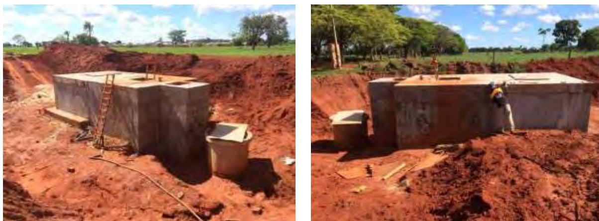
Figura 6: Vista geral da EEEB 002 em implantação, Batayporã, MS.

A EEEB 002 em implantação, de acordo com o Sistema Interativo de Suporte ao Licenciamento Ambiental (SISLA) de MS, não se sobrepõe a nenhuma Unidade de Conservação ou Zonas de Amortecimento, nem a Terras Indígenas, Áreas de Perambulação, Quilombolas e Assentamentos Rurais.