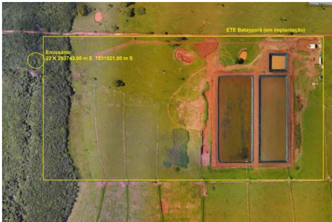
Figura 3: Vista aérea da ETE Batayporã em implantação e entorno, Batayporã, MS.

A ETE Batayporã em implantação, de acordo com o Sistema Interativo de Suporte ao Licenciamento Ambiental (SISLA) de MS, não se sobrepõe a nenhuma Unidade de Conservação ou Zonas de Amortecimento, nem a Terras Indígenas, Áreas de Perambulação, Quilombolas e Assentamentos Rurais (Figura 4).